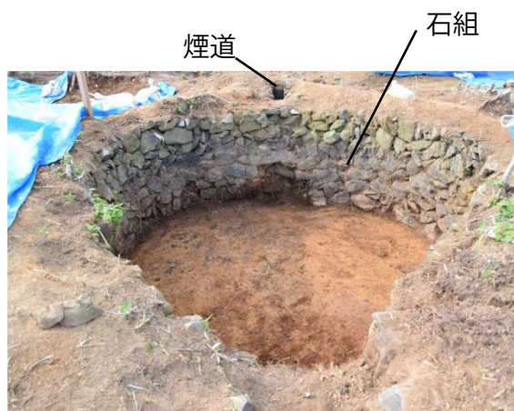
〔炭焼窯完掘（南から）〕

「土塁」の高まりを利用して、炭焼窯が造られていました。中からは、瓦や屋根・壁と思われる焼けた粘土の塊、炭などが見つかりました。