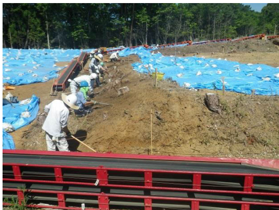
〔「土塁」調査状況（東から）〕