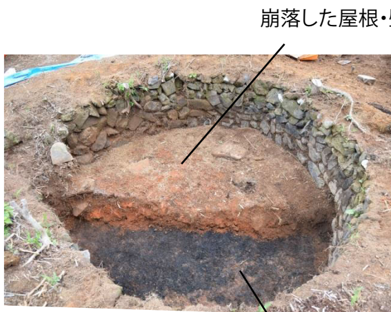
〔炭焼窯半裁（東から）〕 炭

「土塁（どるい）」の内側では、建物の柱穴と考えられる小さな穴が少数見つかりました。「土塁」以外の場所では、埋土に炭や焼土を含む穴や壁が焼けている穴が見つかりました。現在のところ、土器は表土掘削中に戦国時代（約550～450年前）ごろの播鉢が少量出土したのみです。今後の調査に期待したいと思います。