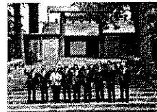
各国首脳の神宮訪問やG7伊勢志摩首脳宣言での平和発信