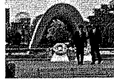
米国のオバマ大統領(当時)の広島訪問の実現