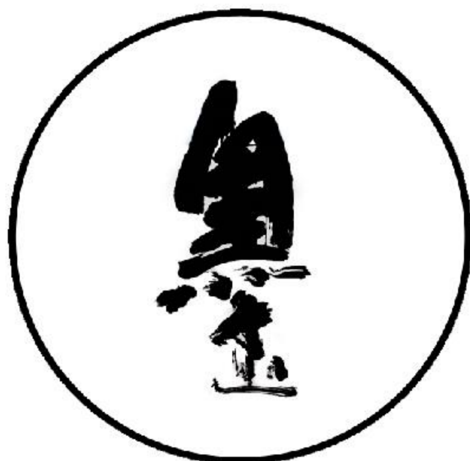
経済産業大臣指定 伝統的工芸品 鈴鹿墨

9月1日(金) ~ 3日(日) (1日) 10:00~17:00 (2日) 10:00~17:00 (3日) 10:00~16:00