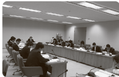
三重県手話言語条例に関する条例検討会の様子