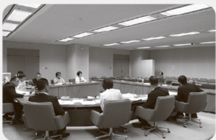
特別委員会での参考人招致の様子

また、重要な議案などについて、利害関係者や学識経験者などから意見を聴く参考人招致を行います。