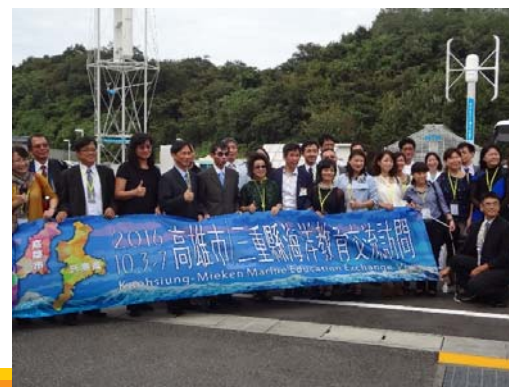
(NTNグリーン パワーパーク)