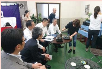
(桑原鋳工株式会社 視察の様子)