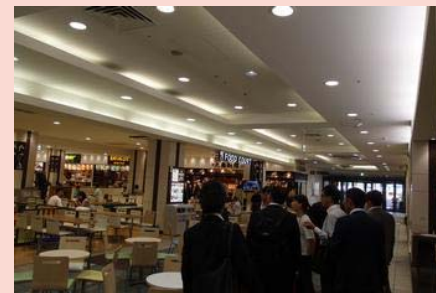
(イオンモール桑名 視察の様子)