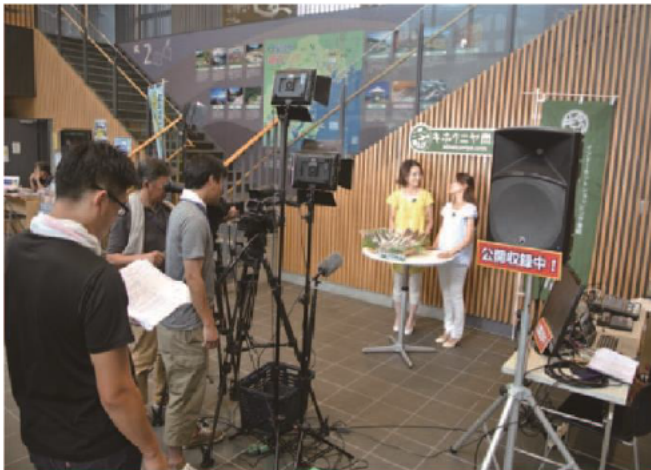
地域振興施設『始神テラス』における公開収録の様子