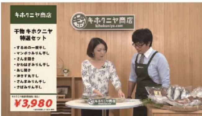
商工会内常設スタジオ「Studio UTV」での番組の様子

みえ熊野古道商工会は、全国の商工会で初めて常設のインターネットスタジオ『Studio UTV』を平成26年に商工会館内に設置。