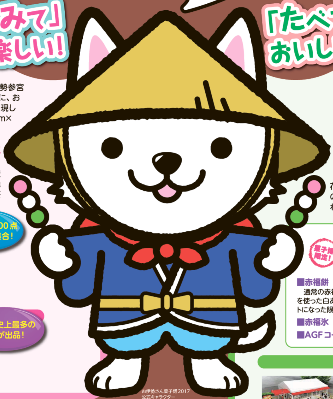
お伊勢さん菓子博2017 公式キャラクター いせわんこ ©菓博三 2017