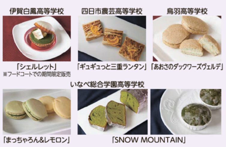
伊賀白鳳高等学校 「シェルレット」 ※フードコートでの期間限定販売 四日市農芸高等学校 「ギョクユツと三重ランタン」 「あおさのダックワースヴェレド」 鳥羽高等学校 「まっちゃろん&レモロン」 いなべ総合学園高等学校 「SNOW MOUNTAIN」

県内のお菓子メーカーによる県産食材を使ったオリジナル新商品が登場! さらに、県内高校生たちがレシピ考案したスイーツも商品化!