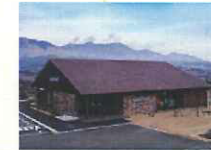
アウトドアスポーツショップ