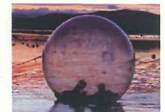
ウォーターボール