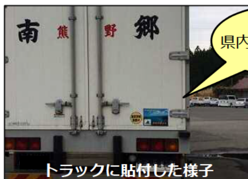
トラックに貼付した様子