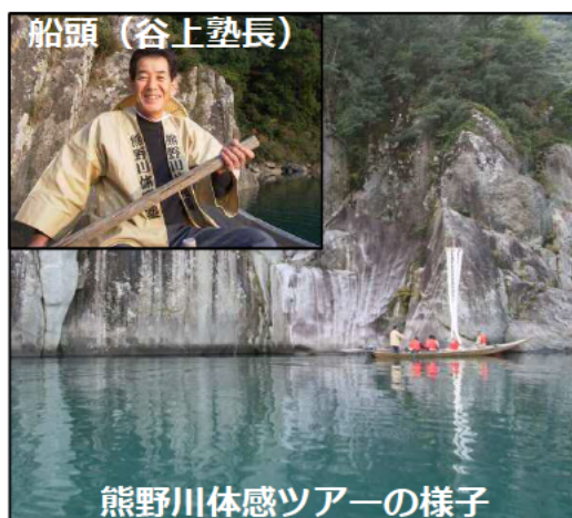
熊野川体感ツアーの様子

熊野川体感塾は、『川の古道/世界遺産・熊野川の魅力をまるごと体感できる交流空間づくり』をテーマにまちづくりを実践しています。川風を受けて進む三反帆(川舟)で熊野川を巡る体感ツアーを開催しています。(予約制)