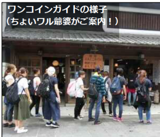
ワンコインガイドの様子 (ちよい丸爺婆がご案内！)

松本峠・熊野市部会は、『まちの原風景から神々との出会いへといざなう“癒し”“もてなし”の交流空間づくり』をテーマにまちづくりを実践しています。また、まちなか案内人による木本ワンコインガイドを実施しています。