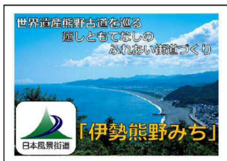
完成したステッカー