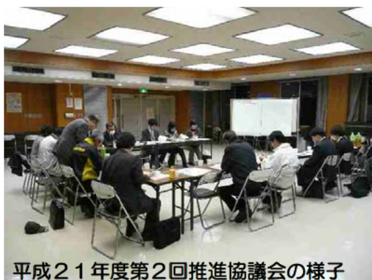
平成21年度第2回推進協議会の様子