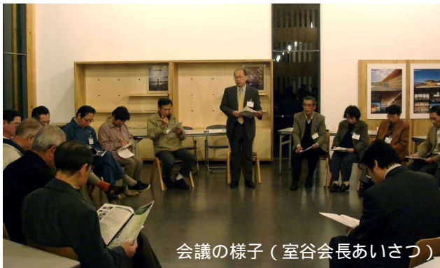
会議の様子(室谷会長あいさつ)