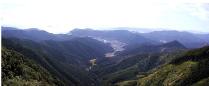
◆ ツツラト峠からの眺望