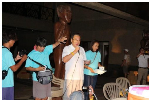
開始にあたってあいさつを行う石垣副知事

三重県訪問団とパラオ国民との交流事業の一つとして、参加者の環境保護意識の向上及び健康増進に資するとともに、三重県とパラオ共和国との友好関係の深化を目的に、交流・クリーンアップ活動イベントを実施しました。パラオ国民やパラオ在住日本人等約 180 名が参加し、4 つのコースに分かれて道路や海岸のごみ拾いを行いながらウォーキングをし、参加者には記念品として友好提携 20 周年をアピールするオリジナル T シャツを配布しました。ウォークソン終了後は、水分補給等を行いながら、参加者同士で交流を深めました。