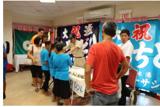
県立水産高等学校 PR ブース (ロープワーク説明)の様子