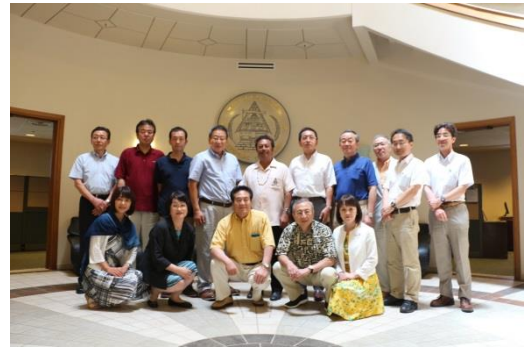
大統領と訪問団との記念撮影