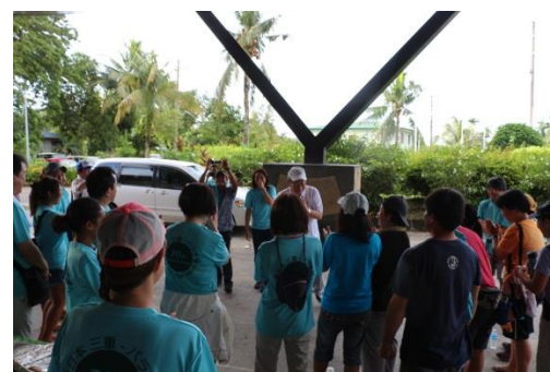
ゴール後の参加者との交流 (写真中央奥は石垣副知事)