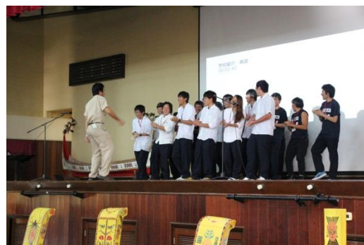
県立水産高等学校生徒による学校紹介の様子