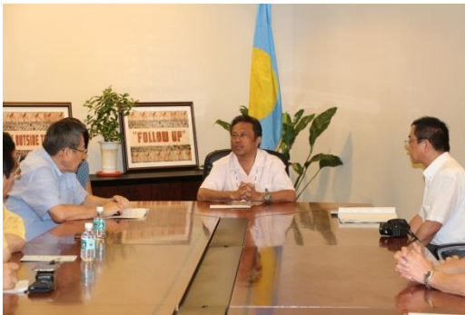
意見交換の様子（写真左から石垣副知事、 レメンゲサウ大統領、日沖副議長）