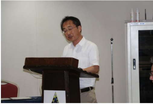
あいさつを行う若井取締役副館長