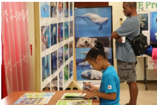
鳥羽水族館 PR ブースの様子