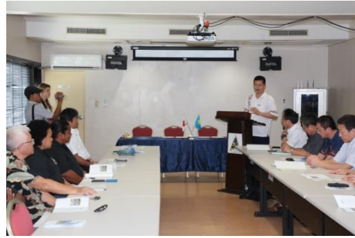
あいさつを行うイムナン CEO