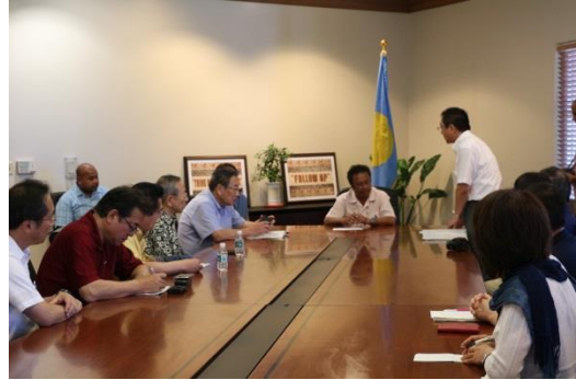
あいさつを行う日沖副議長（写真右奥）