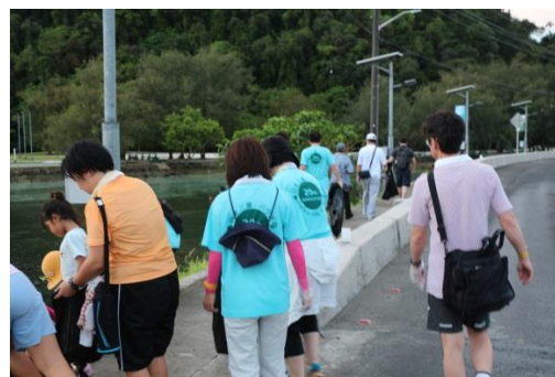
ごみを拾いながらウォーキングを行う参加者