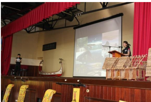
三重県を紹介するプレゼンテーションの様子

また、体験・展示ブースでは、三重県による忍者衣装体験及び手裏剣投げ体験のほか、県立水産高等学校による学校紹介パネル及び航海実習用具等の展示を行い、また鳥羽水族館による館内紹介及びパラオとの交流に関するパネル展示等が行われ、子供から大人まで540名の来場があり大盛況でした。