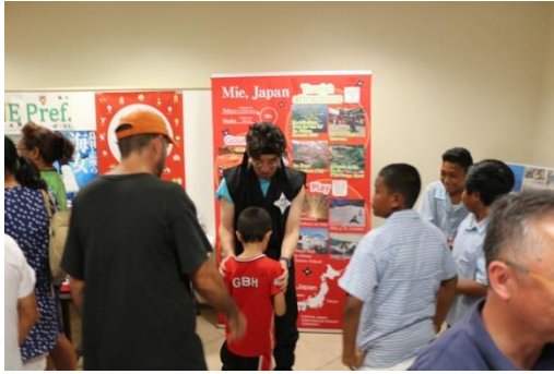
手裏剣投げ体験コーナーの様子