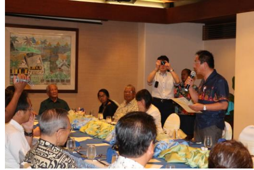
あいさつを行う日沖副議長（写真右） （写真左奥はナカムラ元大統領）