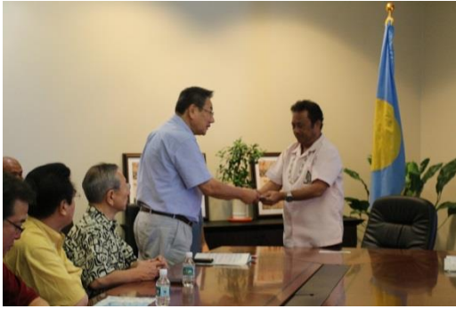
知事親書をレメンゲサウ大統領に 手交する石垣副知事