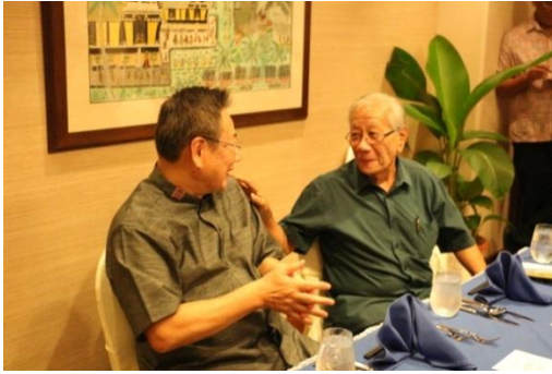
歓談する石垣副知事と ナカムラ元大統領（写真右）