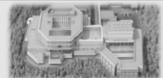
平成29年度開設の県立子ども心身発達医療センターおよび併設する県立かがやき特別支援学校(分校)