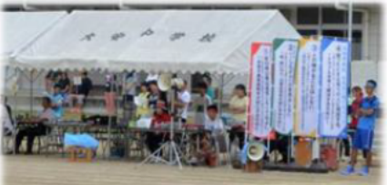
↓SNSに関するルールのぼり完成 20160906