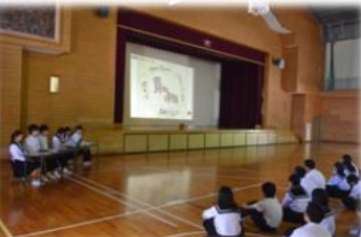
←生徒会 授業の取り組み振り返り集会「SNSに関するルール」の再確認 *アンケートについて 20160701