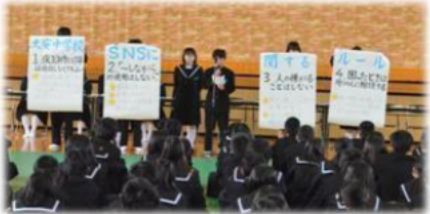
←平成28年4月24日 中日新聞より