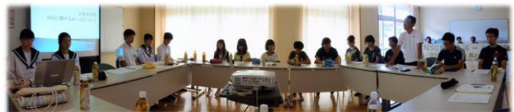
←↑石榑小学校にて児童会&PTA役員への説明会 20160820 *三里小学校 三里まつり (161112) にて発表予定