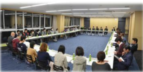
←平成28年度 第2回PTA理事会にて「SNSに関するルール」について 保護者役員に提案 20160408