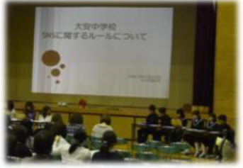
←平成28年度 第2回PTA理事会にて「SNSに関するルール」について 保護者役員に提案 20160408