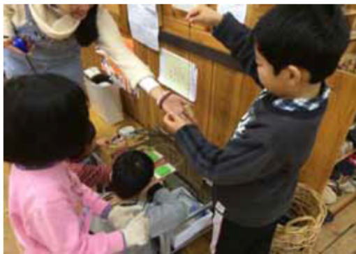
竹笛に紐を付けました

子どもたちは、工作によって竹や自然の材料に触れ、その特性を知ることができたほか、完成した楽器を使って演奏することで、楽しい時間を過ごすことができました。