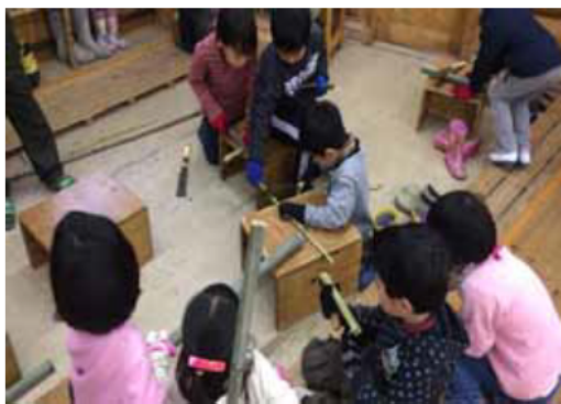
自然の素材を使った楽器作り