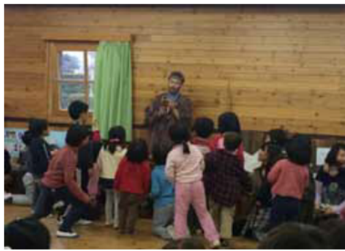
森の木や動物についての話