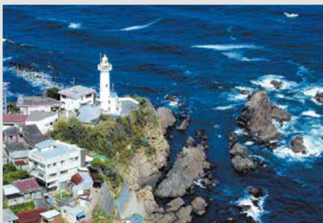
■岸壁の先端に立つ波切の大王埼灯台