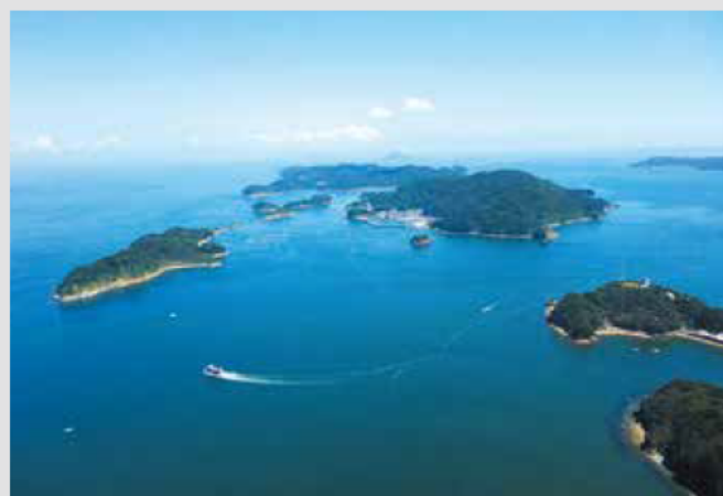
■鳥羽湾に浮かぶ島々