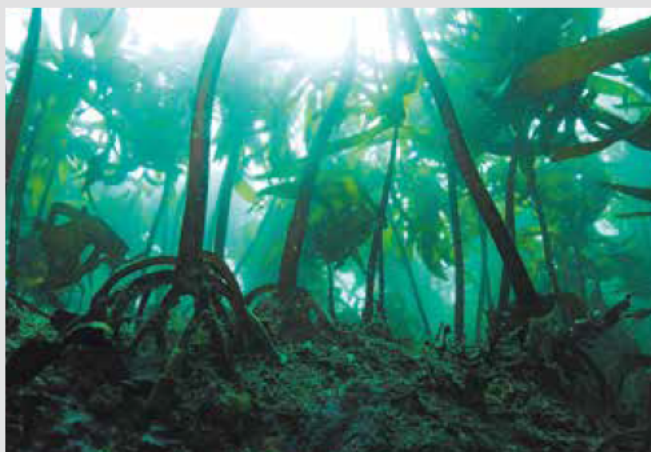
■海女の見える景色、海藻の森

ほかの国立公園に比べると、民有地の割合が96%以上と非常に高く、人の生活圏を多く含むため、伊勢神宮、海女漁、真珠養殖に代表される地域の生活、歴史、文化、風習に深くふれることができるのが特徴で、美しい景観を誇るとともに人と自然の関わりを感じさせてくれる国立公園です。