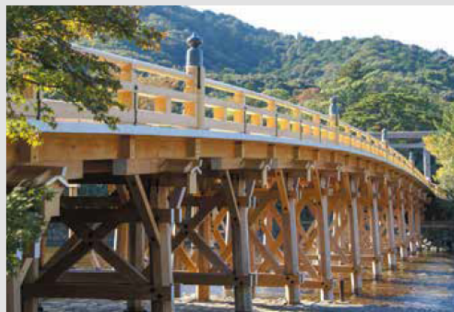
■内宮(伊勢神宮)の五十鈴川にかかる宇治橋