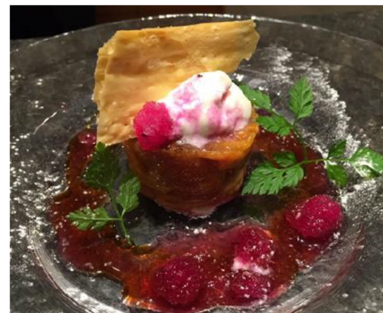
伊勢市との連携によるメニュー開発 (蓮台寺柿のタルトタタン)