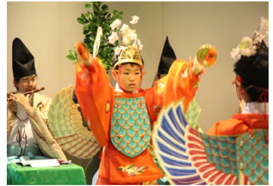
多度雅楽会による「秋の雅楽」(9/26)