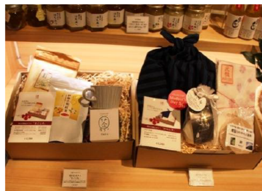
母の日ギフト詰め合わせ