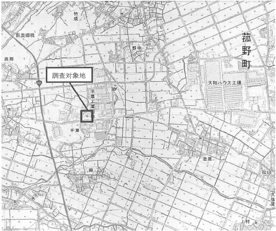
図1 調査対象地案内図