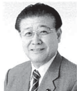
参院議員 市田 忠義 現 1942年、大阪府生まれ。立命館大学卒。参院3期。党国会議員団総会長・参院議員団長。 【活動地域】京都