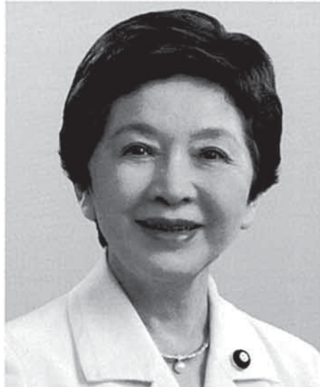
日本のこころ代表 中山恭子 元拉致問題担当大臣