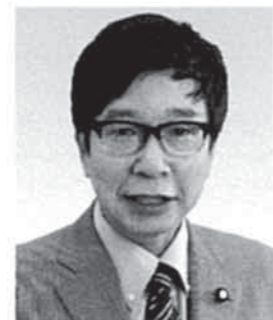
参院議員 大門みきし 現 1956年、京都市生まれ。神戸大学中退。参院3期。党参院国対副委員長。 【活動地域】京都以外の近畿