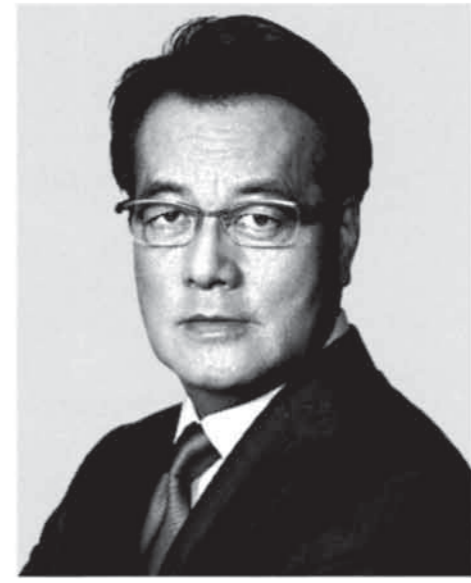
民進党代表 岡田克也