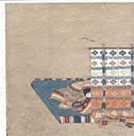
斎宮の耀き～平安の雅と女性の躍動 土佐光起《三十六歌仙図色紙現帖交屏風》部分