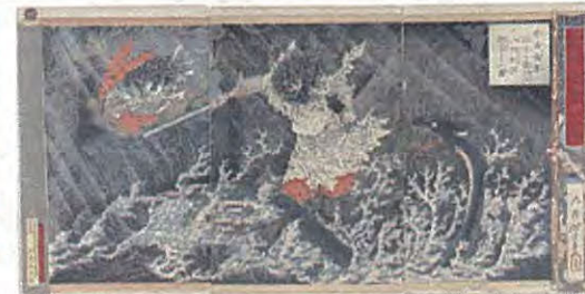
古代の出雲～その限りない魅力～ 月岡芳年《秦斐鳴導出雲の鏡川上に八頭取を遊合したまふ図》