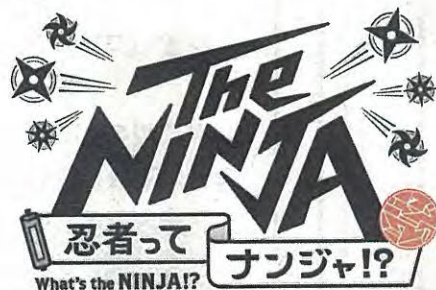
NINJA 忍者ってナンジャ!? 忍者展ロゴ