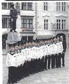
ウィーン少年合唱団

平安時代に活躍した女性の姿を紹介する「斎宮の耀き～平安の雅と女性の躍動」、王朝人の夏の暮らしなどを紹介する「王朝人の暑～い夏」、島根県立古代出雲歴史博物館との連携による「古代の出雲～その限りない魅力～」といった展示を開催します。