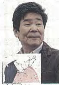
高畑勲さん (三重のまなび2016)