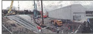
桑名市五反田事案

生活環境保全上の支障等のある4事案について、産廃特措法による国の支援を得て、引き続き恒久対策を進めていきます。