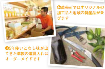
5年使いこなし味が出てきた革製の道具入れはオーダーメイドです