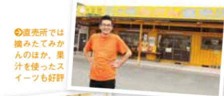
直売所では摘みたてみかんのほか、果汁を使ったスイーツも好評