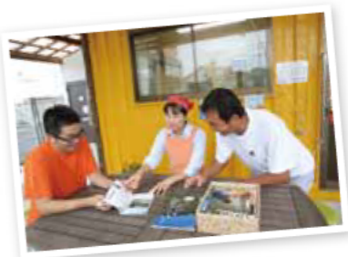
土実樹オリジナル商品など直売所で販売する商品企画はスタッフ全員で考えます

「収穫したみかんなど農産物は、市場へ卸すのではなく、直売所やネットで直接販売しています。自分で育てて、収穫して、販売までするのは大変ですが、お客さんと直接関われるのが何よりも楽しいですね。 南伊勢町は、古くからみかんの生産が盛んな地域です。気候がよく種類もたくさん育つので、知名度をもっと全国区にすることができればブランド価値も高