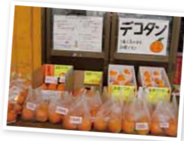
高級みかんデコポン（不知火）と同じ品種で土実樹では「デコタン」が名称

「子どもの頃から遊ぶことより家のみかん農園の手伝いをするのが当たり前でした。さらに祖父からも『父親を手伝って畑をもっと大きくするんだ』というも言われ続けていたので、おのずと進学も4年間みっちり農業を学べる茨城県にある専門学校