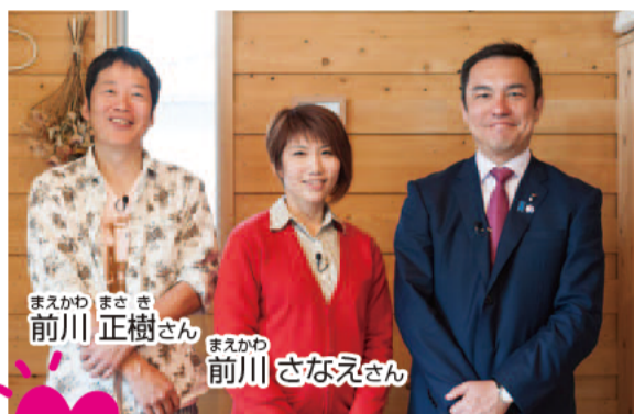
三重を舞台に描く夢