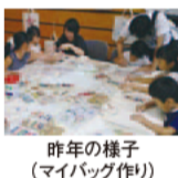
昨年の様子(マイバッグ作り)

体験や工作、講義、展示などを通して、身近な自然や環境問題について楽しく学べるイベントです。