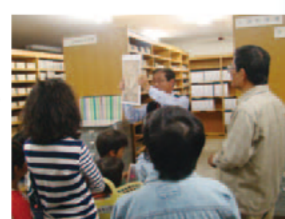
館内ガイドツアーの様子