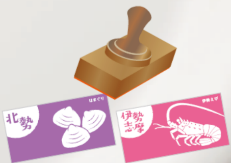
※スタンプのイメージ

「みえ旅案内所」に立ち寄ってスタンプを集めると、特産品などのプレゼントが当たる抽選に応募できます!