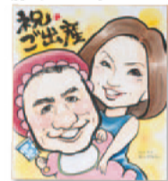
2人目の子どもが生まれたお祝いに、絵をプレゼントしてもらいました。