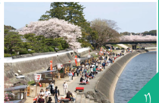
参拝客の憩いの場となっている五十鈴川