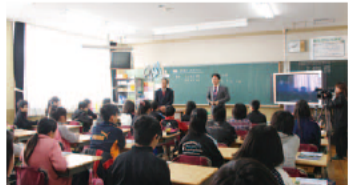
昨年度の出前講座の様子

みえ県議会出前講座は、学校からの申し込みを受けて実施しています。詳しくは、議会事務局までお問い合わせください。各学校からのお申し込みをお待ちしています。