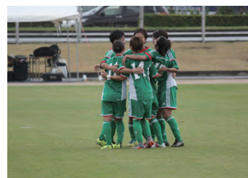
サッカー女子優勝(H27和歌山国体)

本県選手の活躍は、県民の皆さんに夢と感動を与えると同時に、一体感を醸成し、郷土への思いをともにすることができます。国体開催年での天皇杯・皇后杯の獲得をめざすとともに、国体後もジュニア・少年選手や成年選手の安定した競技力の確保に努めます。