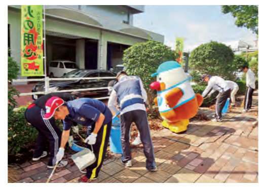
ボランティアによる環境美化運動 (H26長崎国体)

①県民の皆さんにあらゆるかたちで国体を支えていただくため、学校やNPO法人、地域コミュニティ、企業、各種団体などの協力をいただき、総合開・閉会式での大会運営ボランティア等の育成、確保に努めます。また、「みえのスポーツ応援隊」等、県民の皆さんがボランティアに参加しやすい環境づくりに努めます。