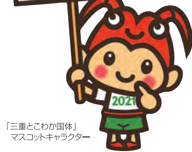
「三重とわか国体」マスコットキャラクター