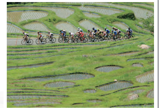
ツール・ド・熊野

国体の開催は、三重県の魅力を全国に発信する絶好の機会であることから、国体開催を通じて観光振興や県産品等のPRなど地域活性化の取組に結びつけていくとともに、会場となった施設等を活用したスポーツイベントの誘致促進など、国体の開催を契機として、スポーツを通じた地域の活性化に向けて、市町、競技団体等とともに取り組んでいきます。