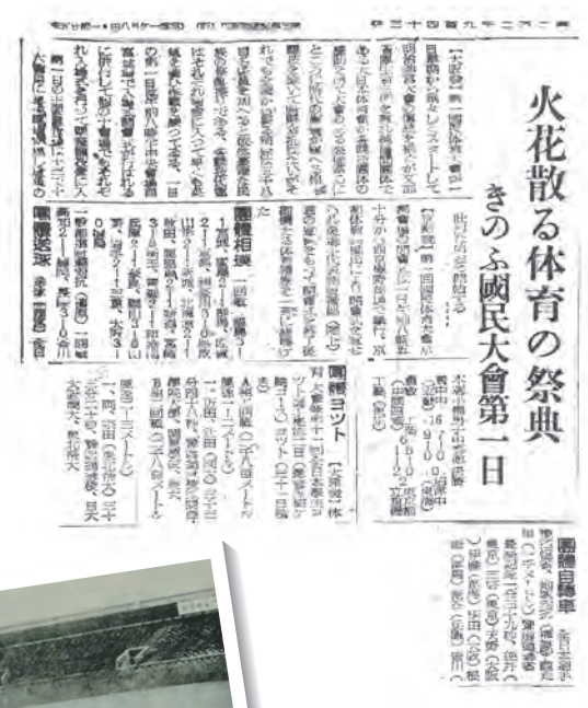
第1回国民体育大会の結果を伝える記事 (昭和21年11月2日伊勢新聞)

なお、平成13年第56回宮城大会から、国体終了後、開催県で全国障害者スポーツ大会が開催されるようになりました。