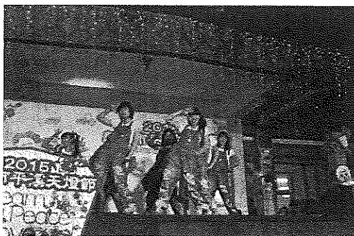
コラボソングで会場を盛り上げた ALLOVER