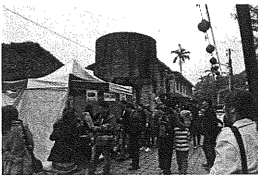
菁桐駅付近に設置された三重県 PR ブース

会場近くの菁桐駅前に開設した三重県ブースでは、三重県の代表的な観光資源である忍者、海女などを用いた PR を行い、多くの来場者に三重県をアピールしました。