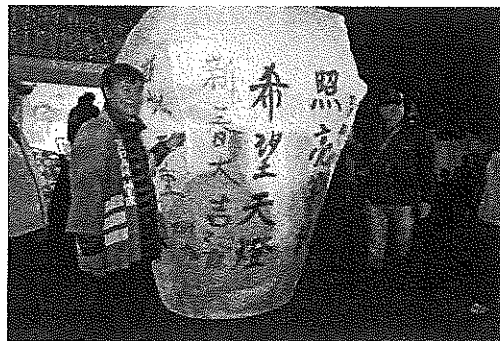
観光交流の増大を願うランタン