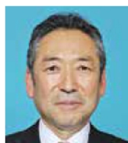
ひがし ひろゆき 東 豊 鷹山