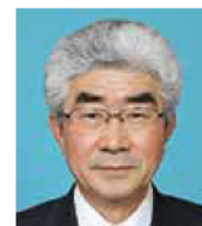
にしむら のぶゆき 西場 信行 自民党