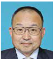
あおき けんじ 青木 謙順 自民党