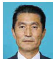
たなか ゆうじ 田中 祐治 自民党