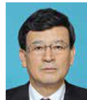
みずたに たかし 水谷 隆 自民党