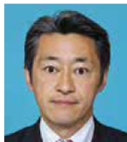
いまい ともひろ 今井 智広 公明党