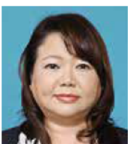
おおく たかあ 大久保 孝栄 鷹山