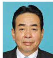
なかむら ひろまさ 中森 博文 自民党