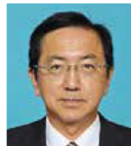
ひ おき まさひろ 日沖 正信 新政みえ