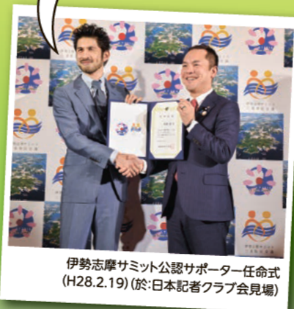
伊勢志摩サミット公認サポーター任命式 (H28.2.19) (於: 日本記者クラブ会場)