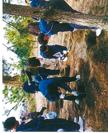
H26 緑の募金交付事業 伊勢市 松の里親会