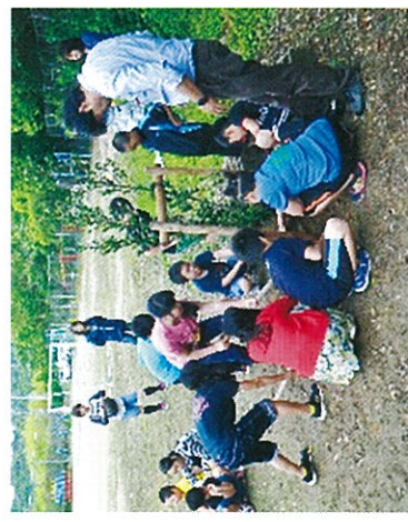
H27 春期緑化運動 志摩市 成基小学校