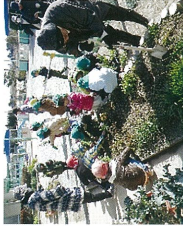
H26 緑の募金交付事業 明和町 幼稚園