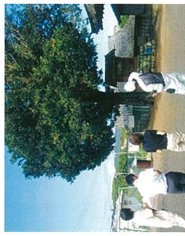
H26 緑地等適正管理事業 志摩市 ナギの樹木健康診断