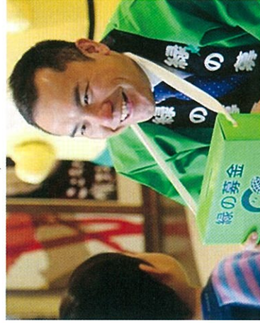
H27 春期緑化運動 三重県 街頭募金