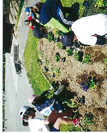
H27 春期緑化運動 大台町 宮川小学校