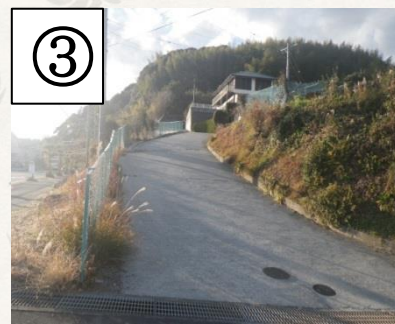
③左手の坂道を上る Go up the slope on the left side.