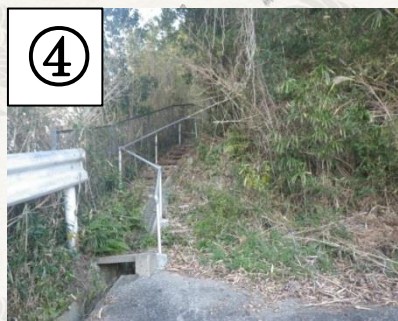
④林道の階段を上る Climb the stairs in the forest road.