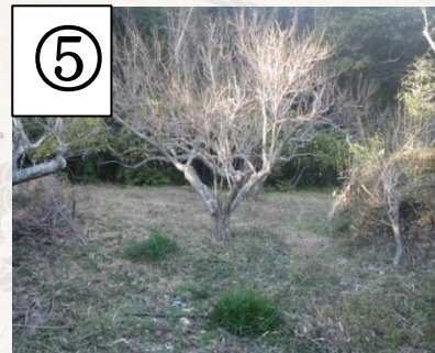
⑤避難場所到着 You are now in the evacuation area.