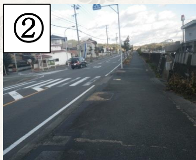
②国道の反対側へ渡る Cross the national road.