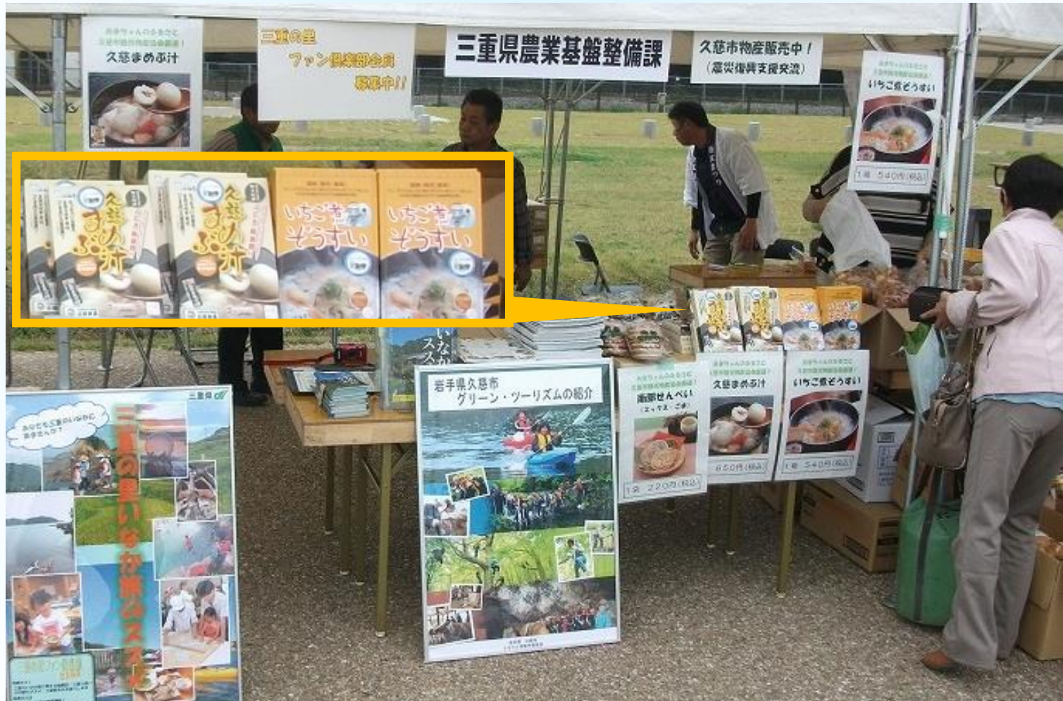
さいくう平安の杜フェスタ (平成27年10月24日)