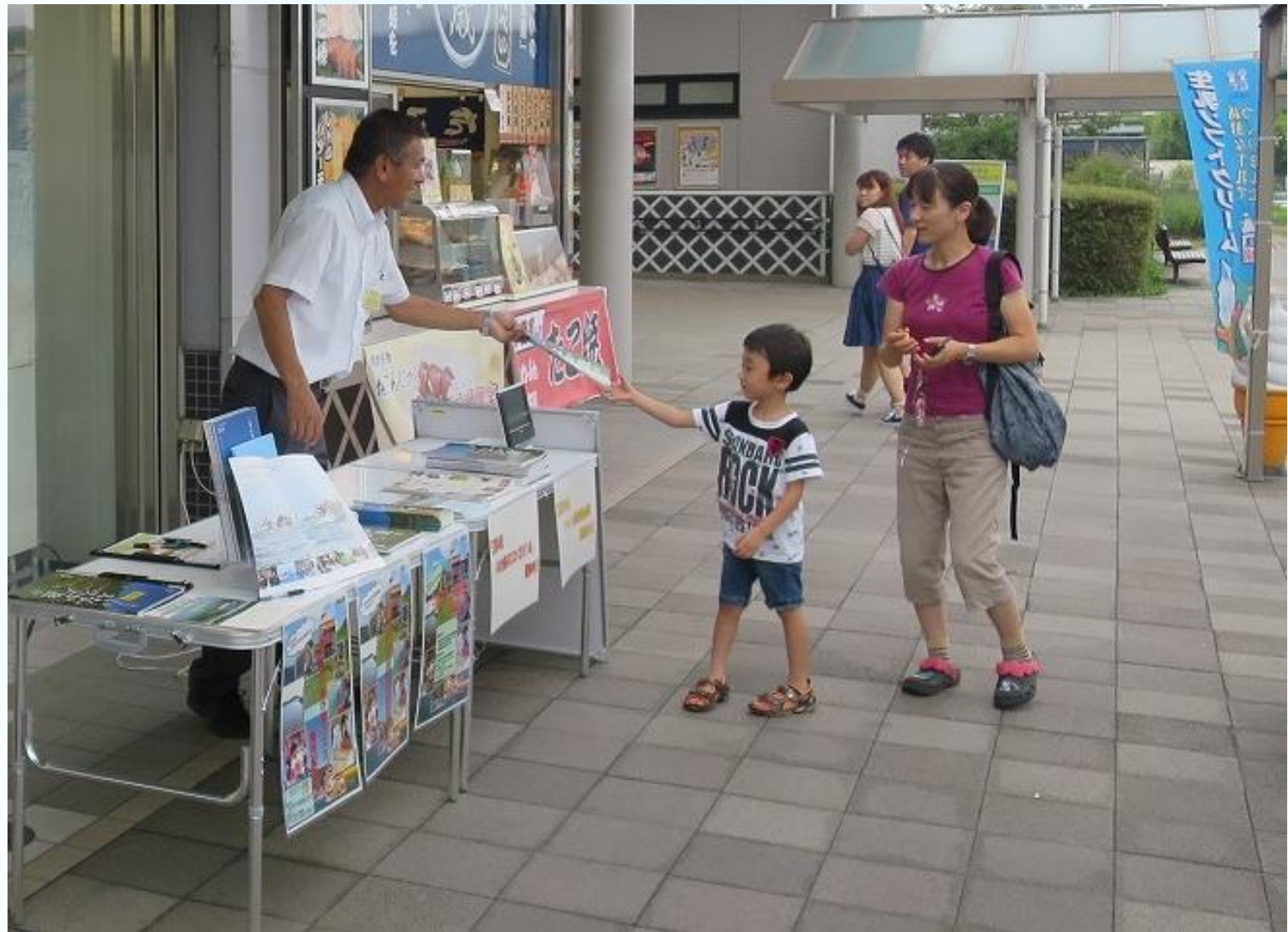
亀山パーキングエリア (平成27年8月21日)