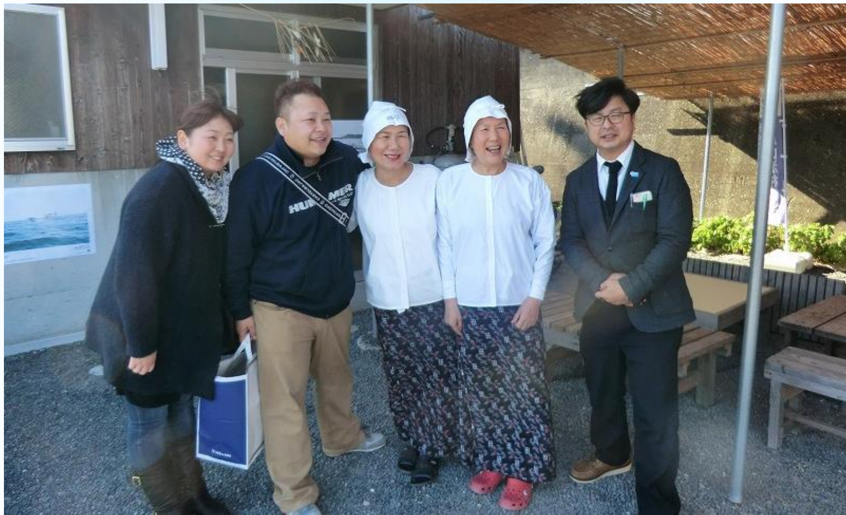
海女体験プログラムの検討（相差町）