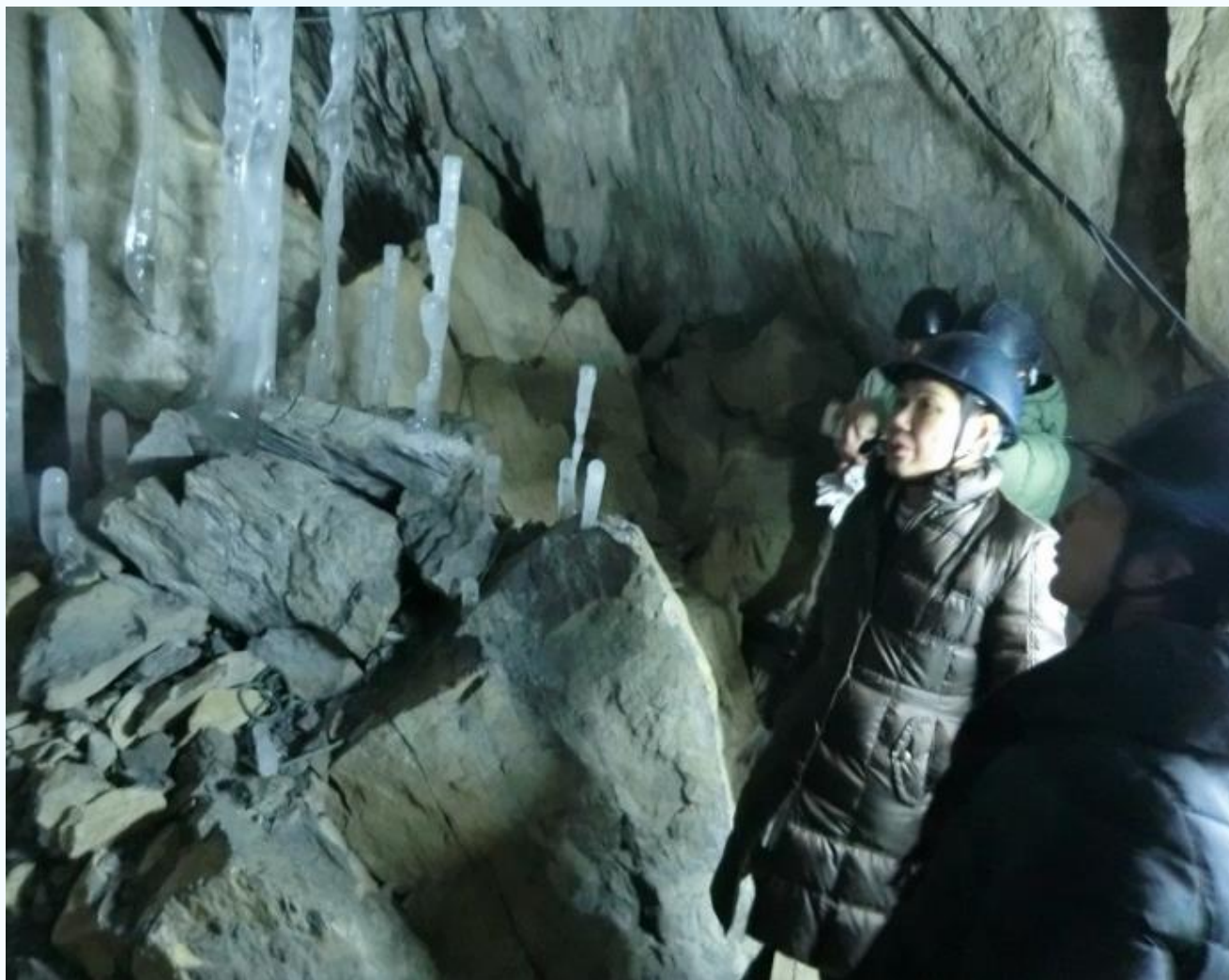
氷筍（ひょうじゅん）観察体験