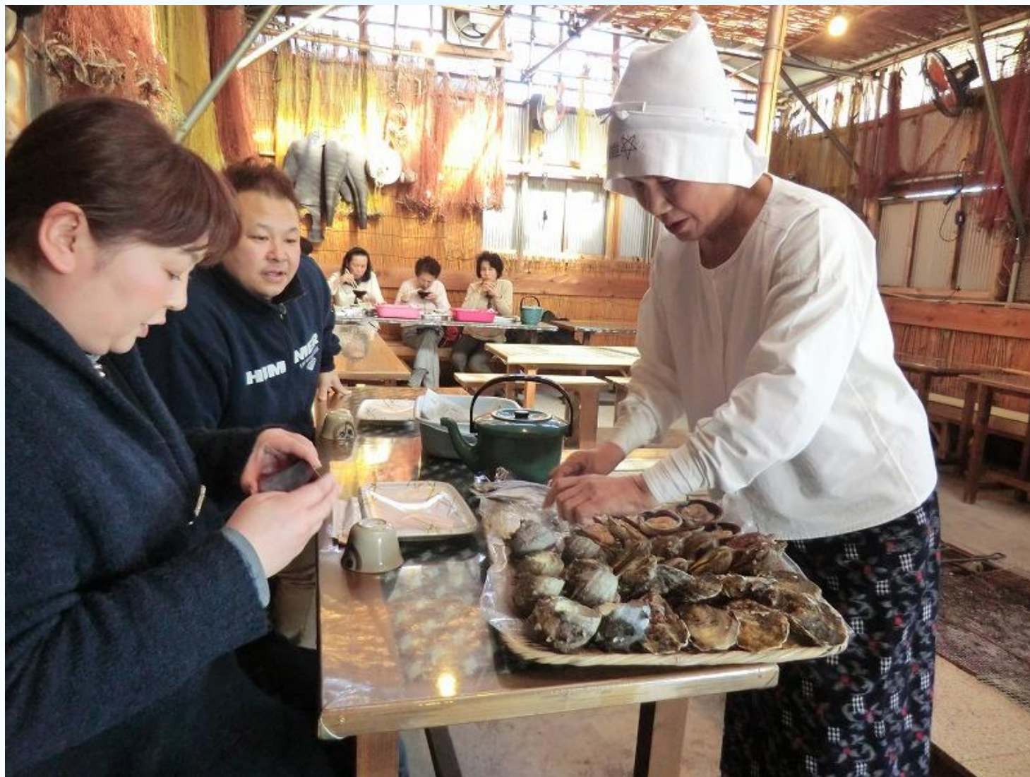
海女文化を伝える取組検討中（久慈市）