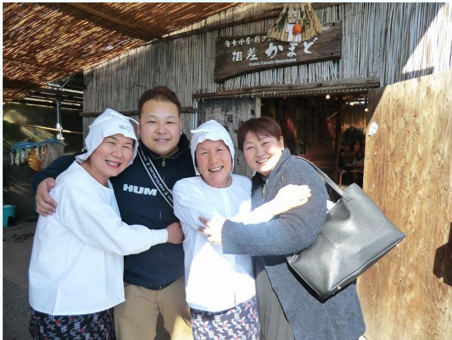
久慈市の実践者2名が相差かまどを訪問（平成28年2月10日）