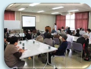
「3月健康教室のようす」