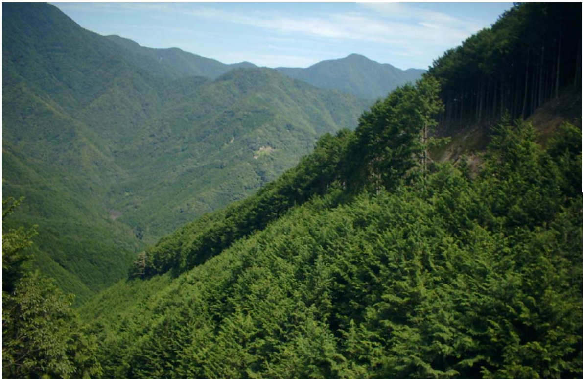
紀北町紀伊長島区