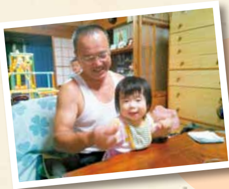
夕食後の一枚。かわいい孫にデレデレのじーじをバシヤリ☆