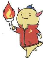
福井しあわせ元気国体(2018年) はびりゅう