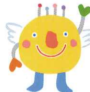
いきいき茨城ゆめ国体(2019年) いばラッキー