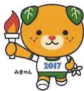
愛顔つなぐえひめ国体(2017年) みぎゃん