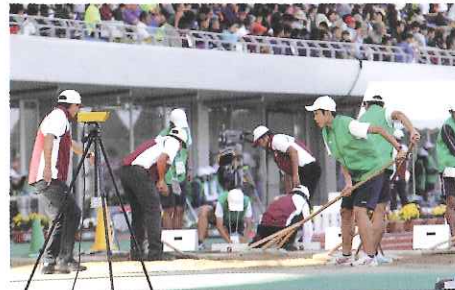
開・閉会式や競技会場運営に参加する