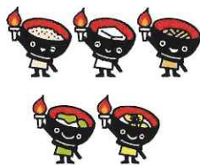
希望郷いわて国体(2016年) わんこきょうだい