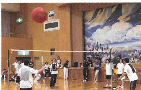
デモンストラシヨンスポーツへの参加