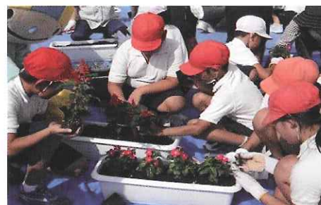
県内の街を花でいっぱいにする