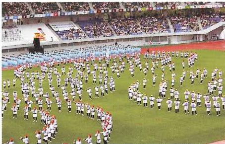
開会式の式典に参加する