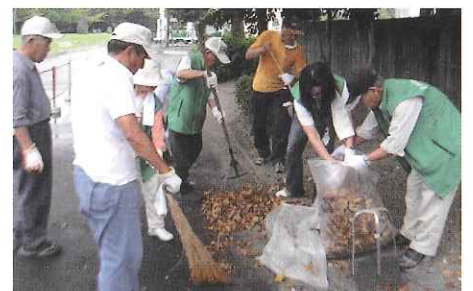
競技会場や道路、河川等の美化運動