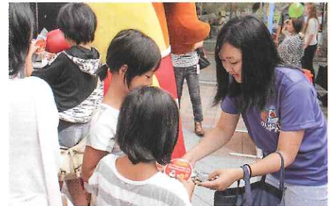
三重の魅力を伝えるおもてなし活動