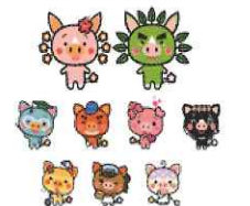
燃ゆる感動かごしま国体(2020年) ぐりぶーファミリー