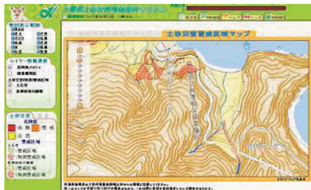
〔土砂災害警戒区域等情報表示画面〕