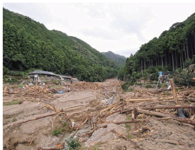
大和田川 (南牟婁郡紀宝町浅里和田)