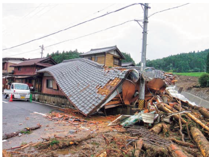
所谷川 (津市美杉町石名原)