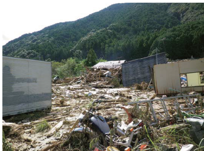
ジャンブの谷 (南牟婁郡紀宝町高岡)