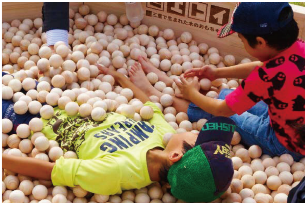
「もりぼーる」や「ツリーイング」をはじめ、木や森に関わる様々な催しを体験する参加者たち