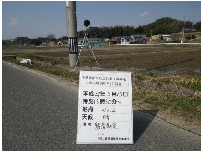
写真 4-2-34 騒音測定(平成 27 年 3 月 13 日) No.2