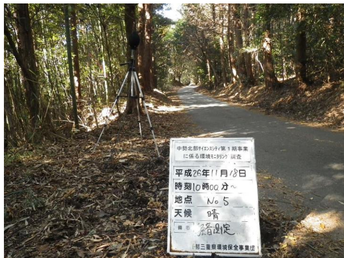
写真 4-2-24 騒音測定(平成 26 年 11 月 18 日) No.5