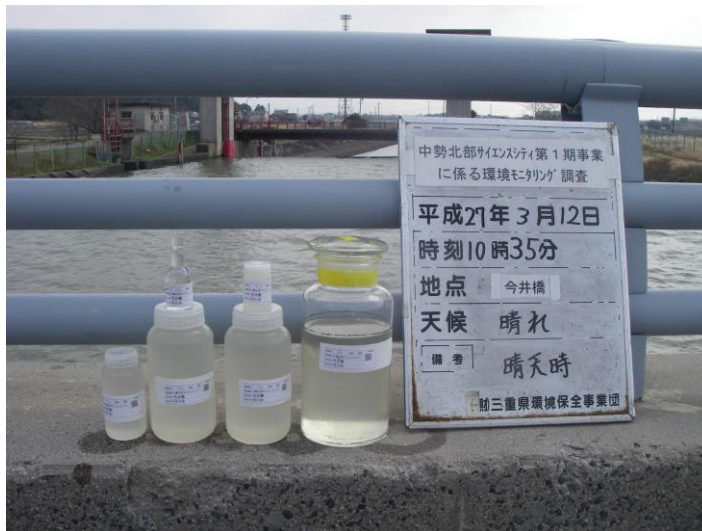
写真 4-1-79 供用後調査状況(今井橋付近)(平成 27 年 3 月 12 日)