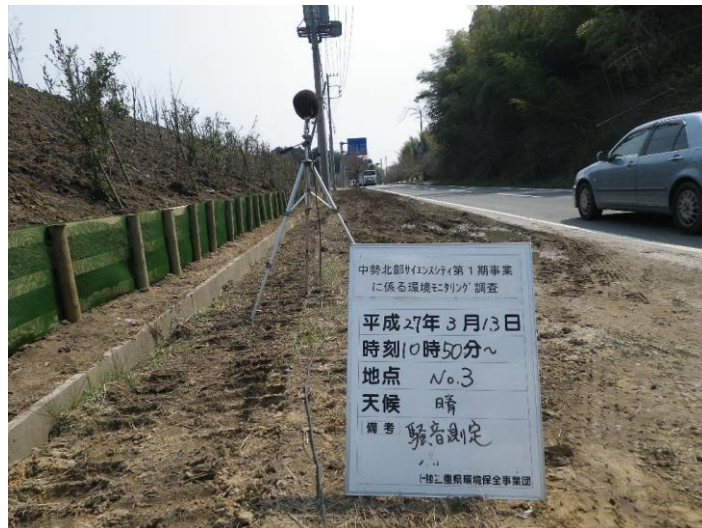
写真 4-2-35 騒音測定(平成 27 年 3 月 13 日) No.3