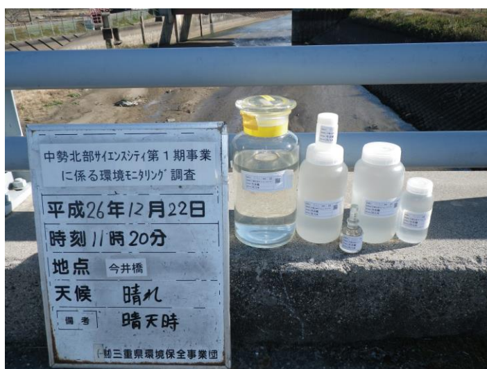
写真 4-1-73 供用後調査状況(今井橋付近)(平成26年12月22日)