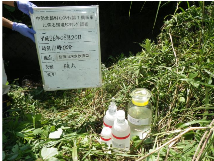
写真 4-1-66 供用後排水調査状況(前田川汚水放流口付近)(平成 26 年 8 月 20 日)