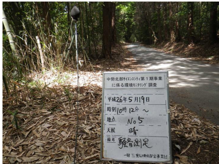
写真 4-2-5 騒音測定(平成 26 年 5 月 19 日) No.5