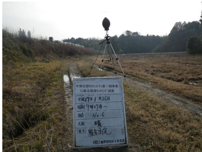
写真 4-2-32 騒音測定(平成 27 年 1 月 26 日) No.6