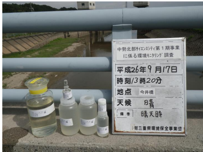
写真 4-1-67 供用後調査状況(今井橋付近)(平成 26 年 9 月 17 日)