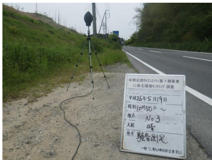
写真 4-2-3 騒音測定(平成 26 年 5 月 19 日) No.3