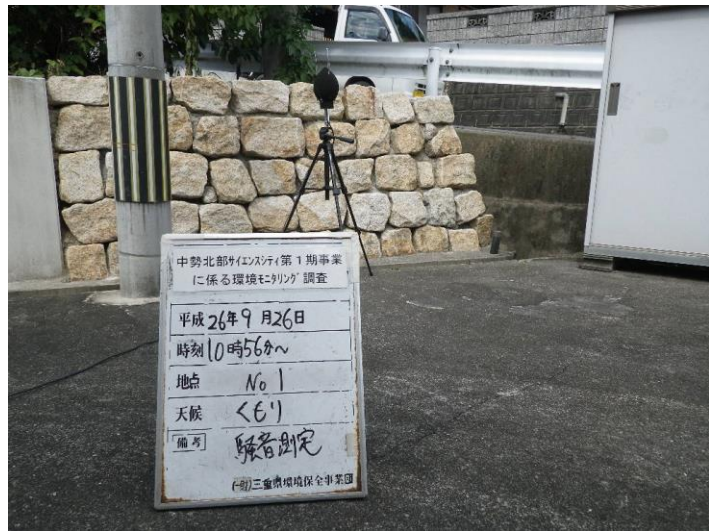
写真 4-2-14 騒音測定(平成 26 年 9 月 26 日) No.1