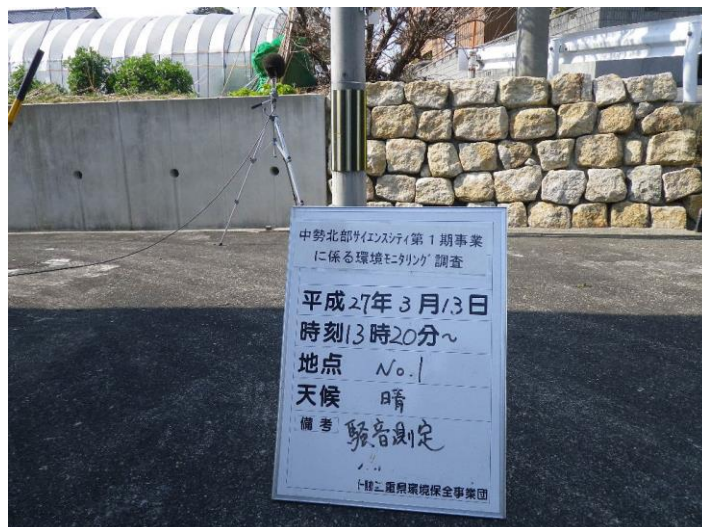
写真 4-2-33 騒音測定(平成 27 年 3 月 13 日) No.1