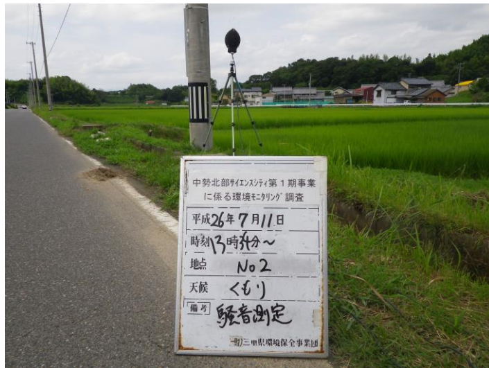
写真 4-2-8 騒音測定(平成 26 年 7 月 11 日) No.2