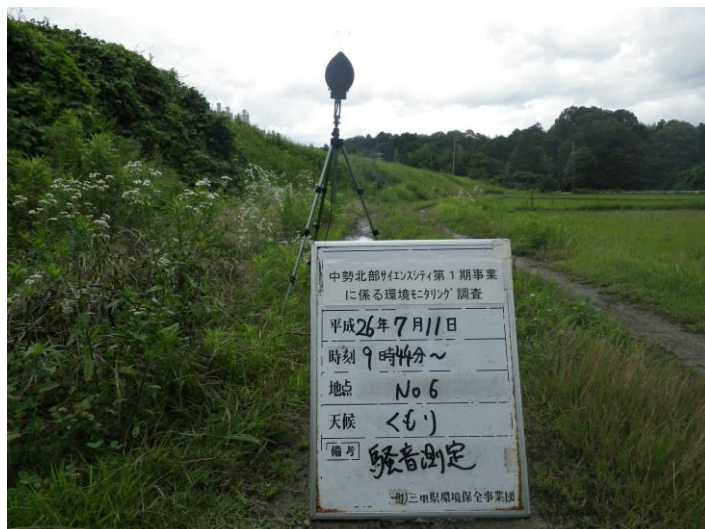
写真 4-2-12 騒音測定(平成 26 年 7 月 11 日) No.6