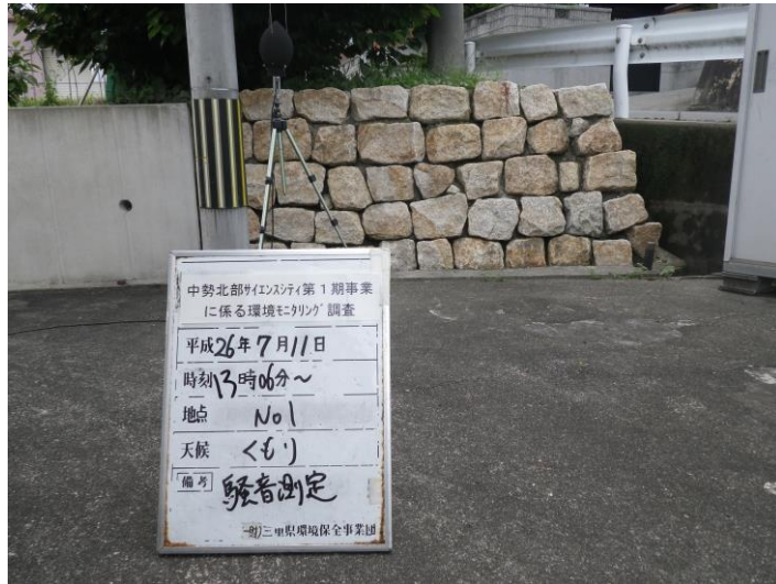
写真 4-2-7 騒音測定(平成 26 年 7 月 11 日) No.1