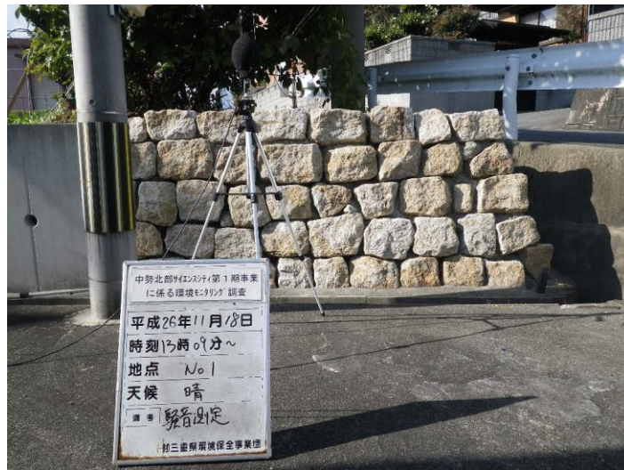
写真 4-2-20 騒音測定(平成 26 年 11 月 18 日) No.1