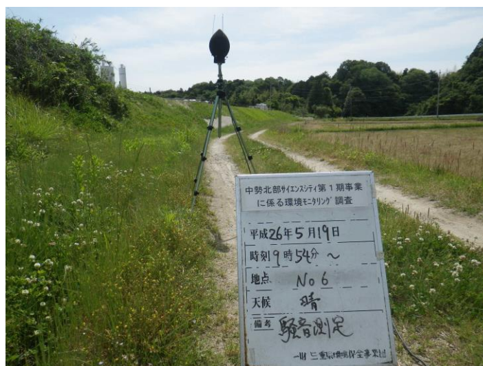
写真 4-2-6 騒音測定(平成 26 年 5 月 19 日) No.6