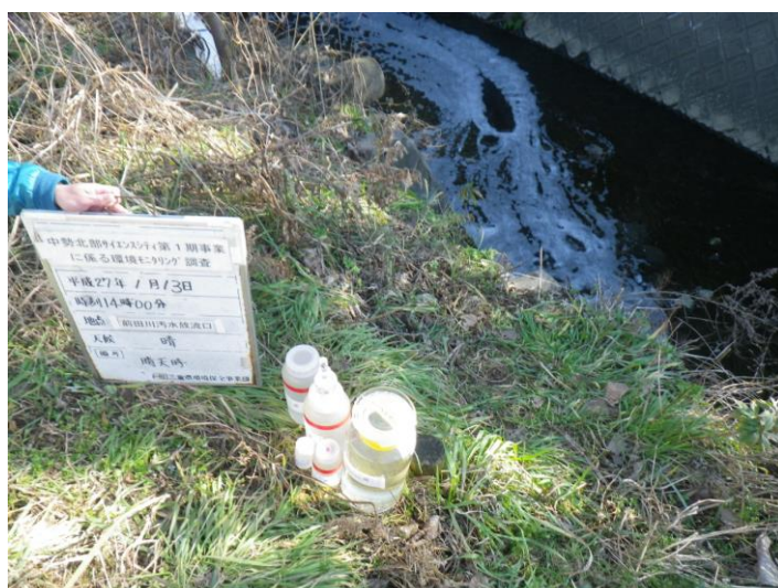
写真 4-1-76 供用後排水調査状況(前田川汚水放流口付近)(平成27年1月13日)