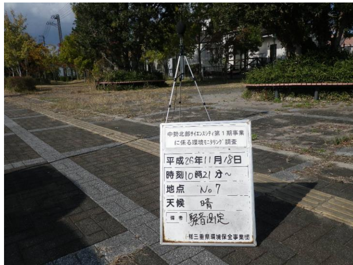
写真 4-2-26 騒音測定(平成 26 年 11 月 18 日) No.7(事業実施区域内)