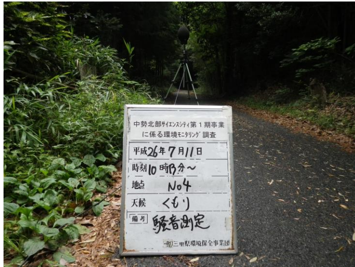
写真 4-2-10 騒音測定(平成 26 年 7 月 11 日) No.4