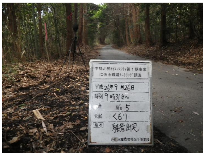
写真 4-2-18 騒音測定(平成 26 年 9 月 26 日) No.5