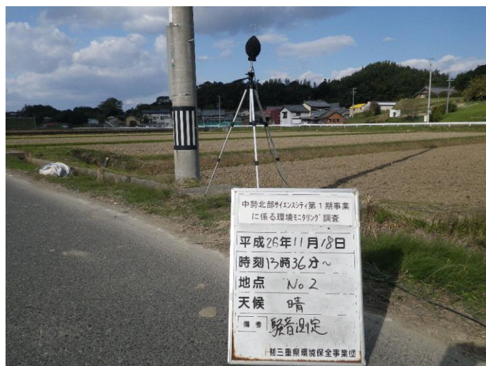
写真 4-2-21 騒音測定(平成 26 年 11 月 18 日) No.2