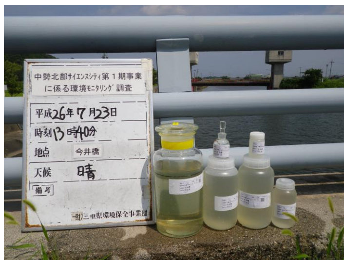
写真 4-1-63 供用後調査状況(今井橋付近)(平成 26 年 7 月 23 日)