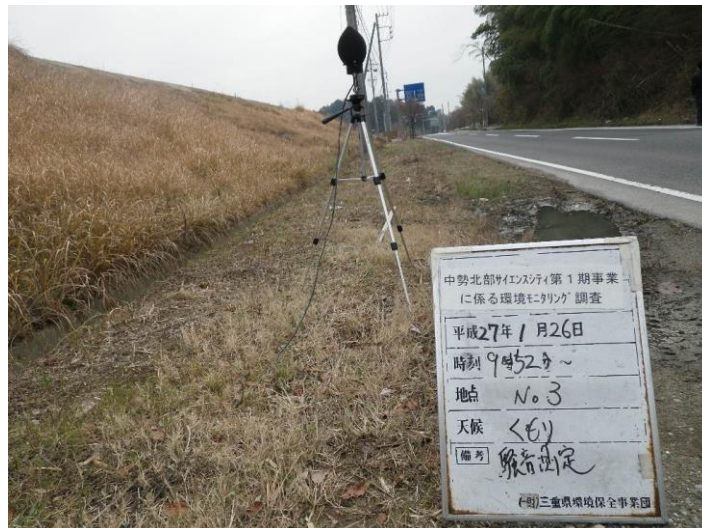
写真 4-2-29 騒音測定(平成 27 年 1 月 26 日) No.3