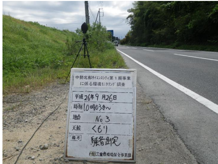
写真 4-2-16 騒音測定(平成 26 年 9 月 26 日) No.3