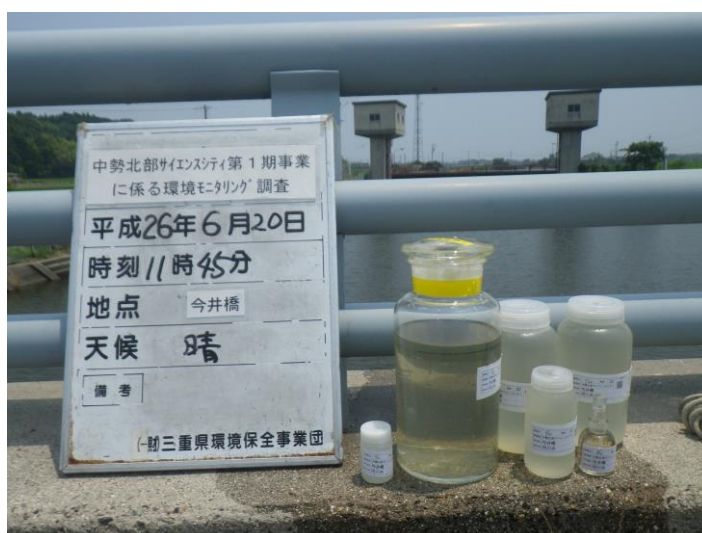
写真 4-1-61 供用後調査状況(今井橋付近)(平成 26 年 6 月 20 日)