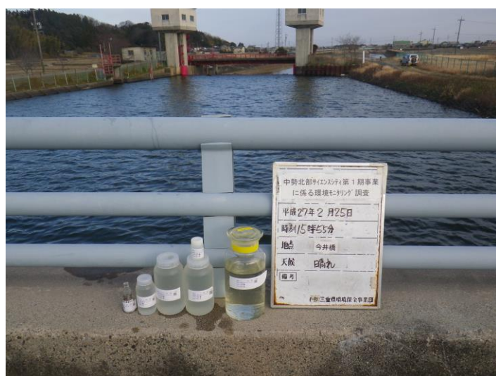
写真 4-1-77 供用後調査状況(今井橋付近)(平成27年2月25日)