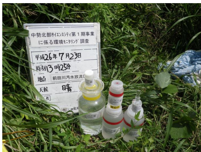
写真 4-1-64 供用後排水調査状況(前田川污水放流口付近)(平成 26 年 7 月 23 日)