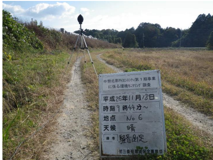
写真 4-2-25 騒音測定(平成 26 年 11 月 18 日) No.6