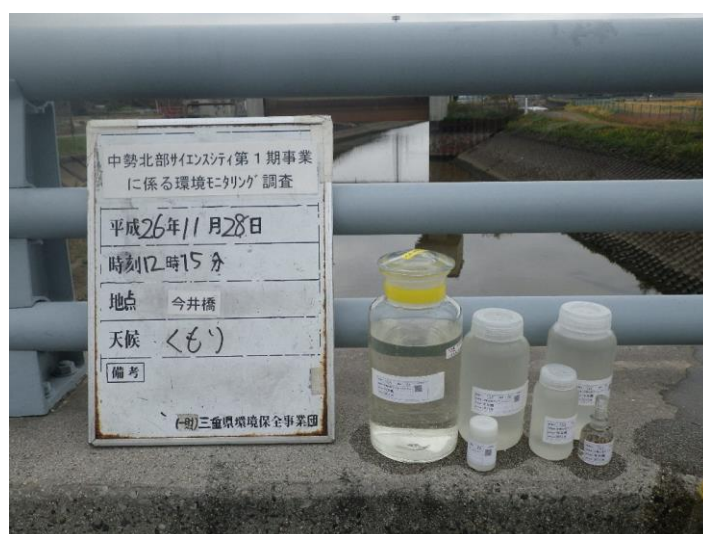
写真 4-1-71 供用後調査状況(今井橋付近)(平成 26 年 11 月 28 日)