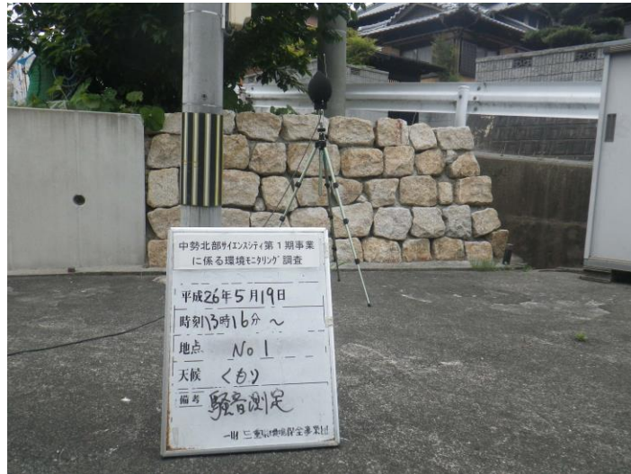
写真 4-2-1 騒音測定(平成 26 年 5 月 19 日) No.1