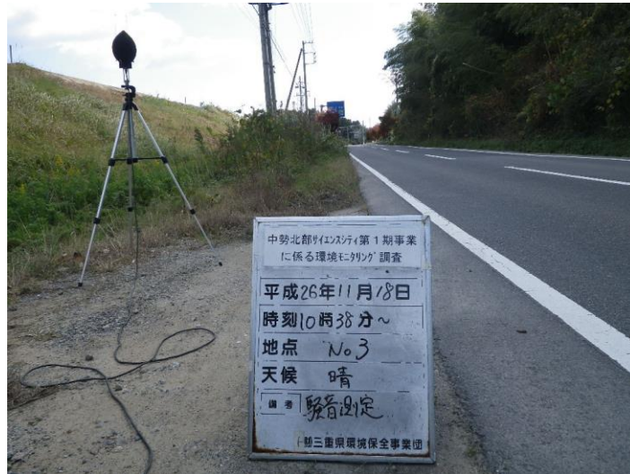
写真 4-2-22 騒音測定(平成 26 年 11 月 18 日) No.3