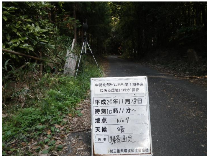
写真 4-2-23 騒音測定(平成 26 年 11 月 18 日) No.4