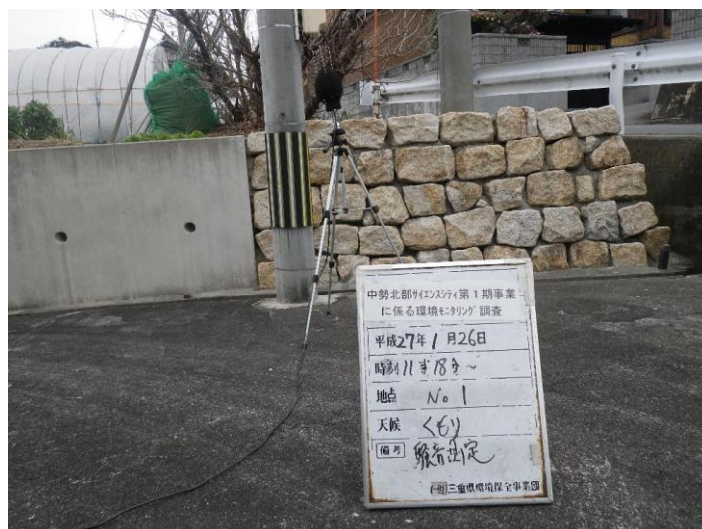
写真 4-2-27 騒音測定(平成 27 年 1 月 26 日) No.1