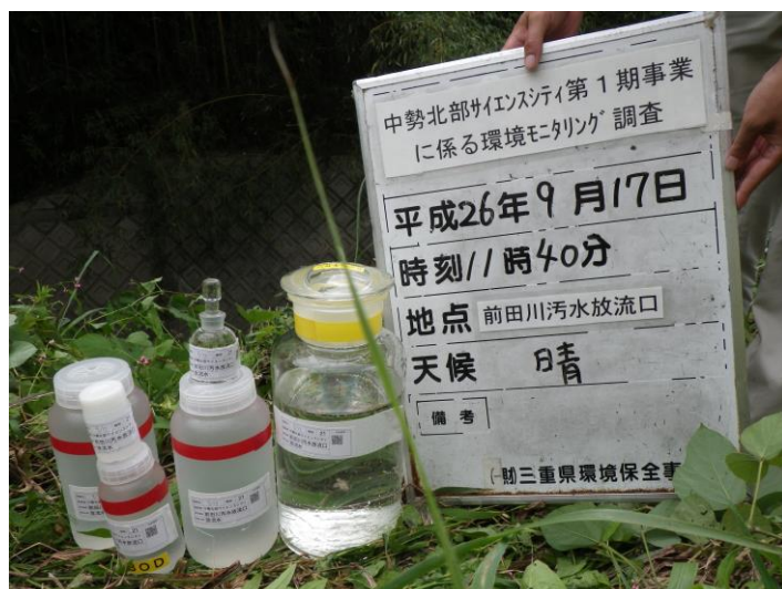
写真 4-1-68 供用後排水調査状況(前田川汚水放流口付近)(平成 26 年 9 月 17 日)