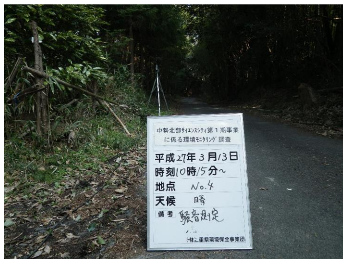
写真 4-2-36 騒音測定(平成 27 年 3 月 13 日) No.4