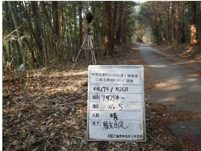
写真 4-2-31 騒音測定(平成 27 年 1 月 26 日) No.5