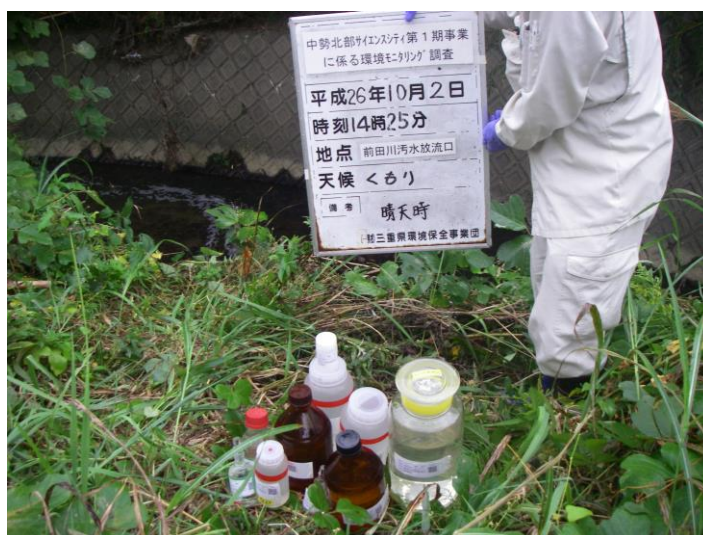
写真 4-1-70 供用後排水調査状況(前田川汚水放流口付近)(平成 26 年 10 月 2 日)