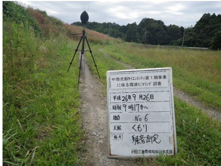
写真 4-2-19 騒音測定(平成 26 年 9 月 26 日) No.6