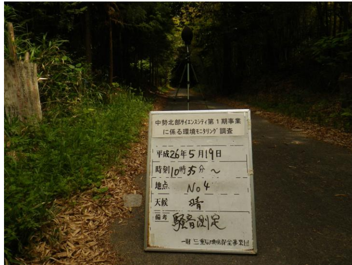
写真 4-2-4 騒音測定(平成 26 年 5 月 19 日) No.4