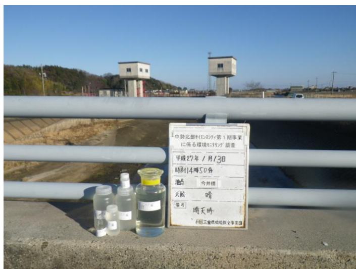
写真 4-1-75 供用後調査状況(今井橋付近)(平成27年1月13日)