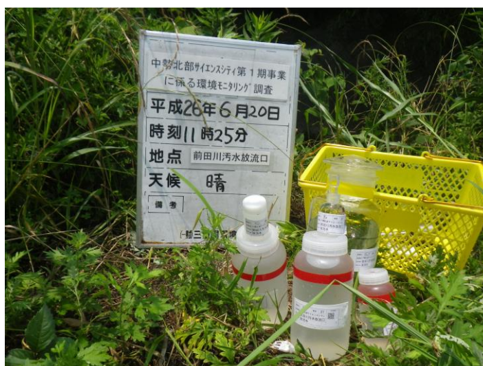
写真 4-1-62 供用後排水調査状況(前田川汚水放流口付近)(平成 26 年 6 月 20 日)