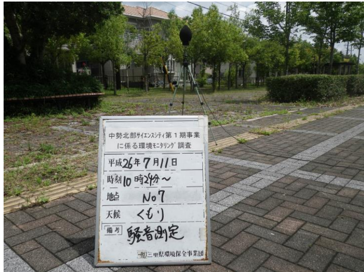
写真 4-2-13 騒音測定(平成 26 年 7 月 11 日) No.7(事業実施区域内)