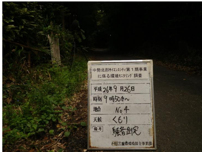
写真 4-2-17 騒音測定(平成 26 年 9 月 26 日) No.4