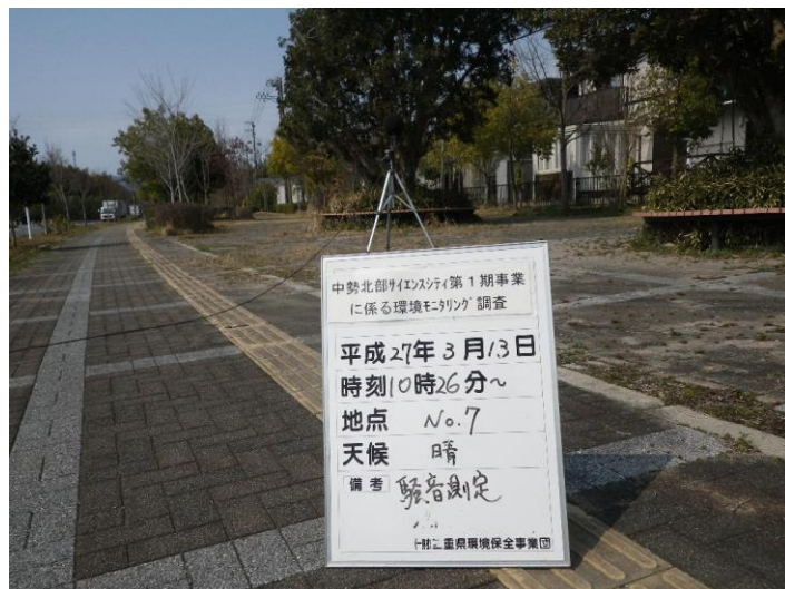
写真 4-2-39 騒音測定(平成 27 年 3 月 13 日) No.7 事業実施区域内