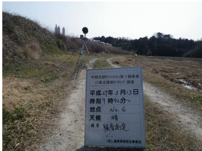
写真 4-2-38 騒音測定(平成 27 年 3 月 13 日) No.6