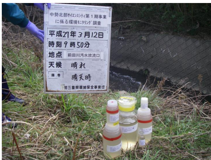
写真 4-1-80 供用後排水調査状況(前田川污水放流口付近)(平成 27 年 3 月 12 日)