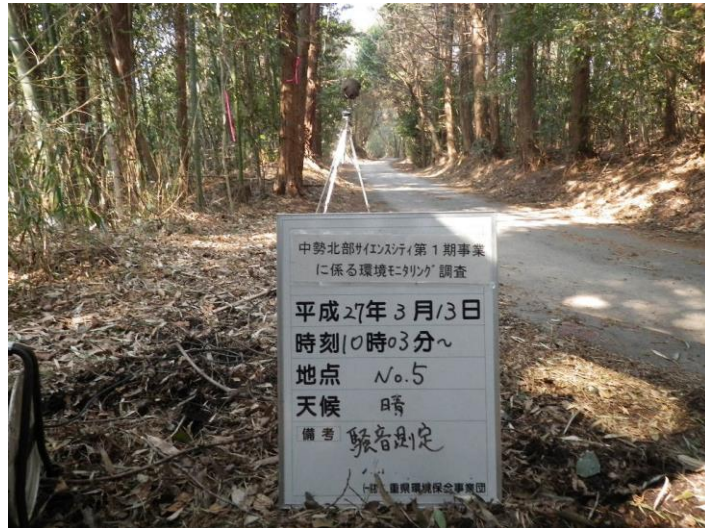
写真 4-2-37 騒音測定(平成 27 年 3 月 13 日) No.5