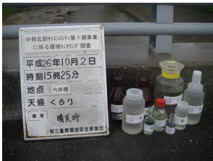
写真 4-1-69 供用後調査状況(今井橋付近)(平成 26 年 10 月 2 日)