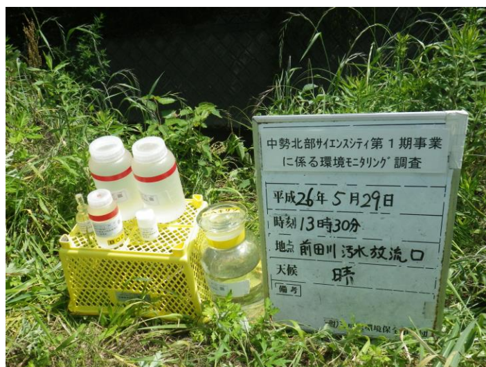
写真 4-1-60 供用後排水調査状況(前田川汚水放流口付近)(平成 26 年 5 月 29 日)