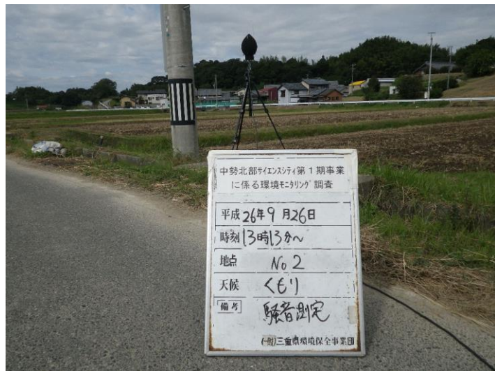
写真 4-2-15 騒音測定(平成 26 年 9 月 26 日) No.2