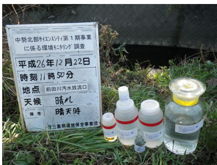
写真 4-1-74 供用後排水調査状況(前田川汚水放流口付近)(平成26年12月22日)