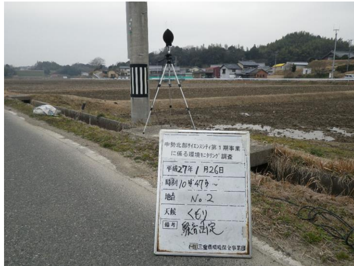
写真 4-2-28 騒音測定(平成 27 年 1 月 26 日) No.2