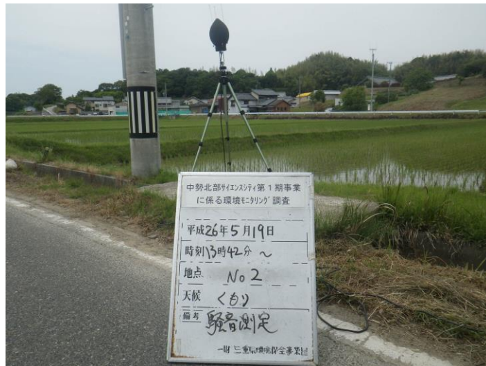
写真 4-2-2 騒音測定(平成 26 年 5 月 19 日) No.2