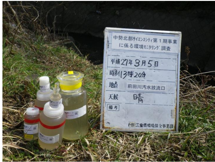
写真 4-1-78 供用後排水調査状況(前田川污水放流口付近)(平成 27 年 3 月 5 日)