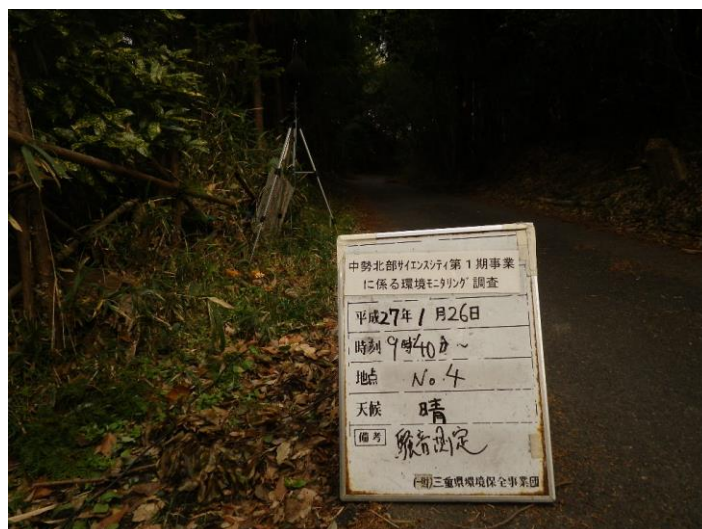
写真 4-2-30 騒音測定(平成 27 年 1 月 26 日) No.4