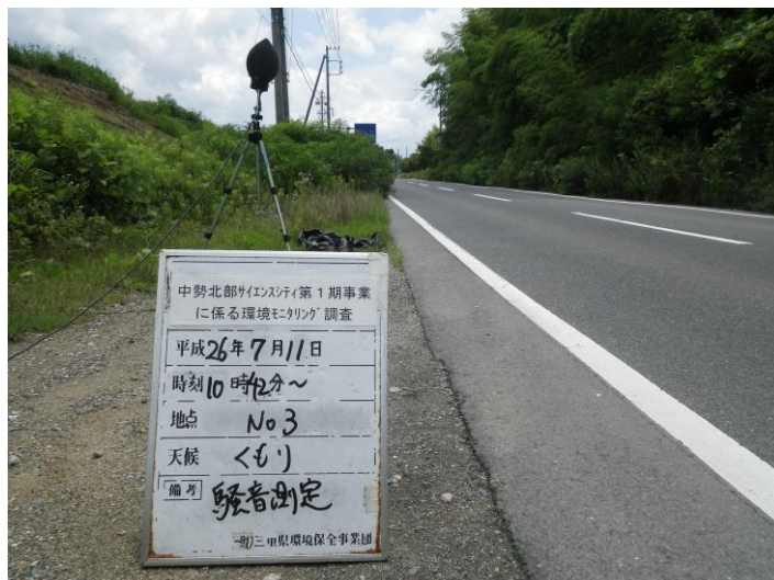
写真 4-2-9 騒音測定(平成 26 年 7 月 11 日) No.3