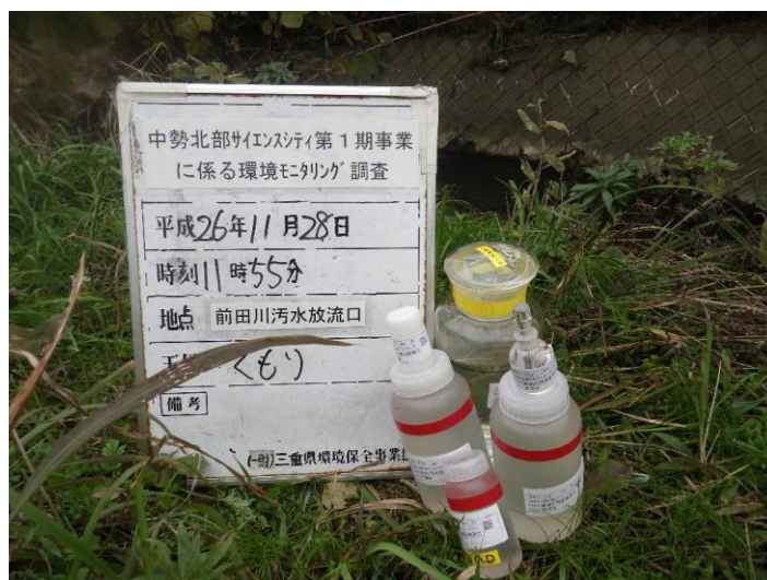
写真 4-1-72 供用後排水調査状況(前田川汚水放流口付近)(平成26年11月28日)