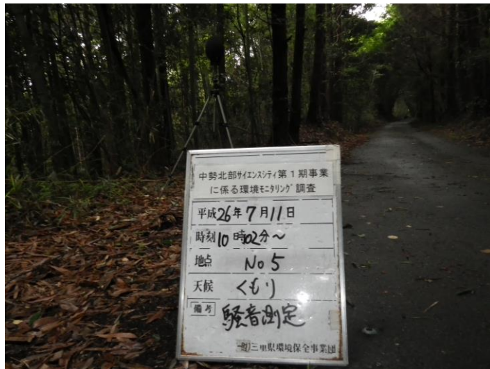
写真 4-2-11 騒音測定(平成 26 年 7 月 11 日) No.5