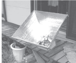
これがソーラークッカーです。中にやかんが入っています。

みんなまず同じ物でやろうということでスタートして、報告会をしています。工夫する方法は二つあると思うんです。一つはなるべく日光を集めて、効率の良いように銀紙を貼った周囲を工夫すること。もう一つは調理器具を工夫するというのが僕はあると思ったんですよ。それで僕は熱伝導率の良い素材を探しました。一番いいのは銀なんですけど、そんな手が出ませんから。実用化に向けて銅の打ち出しのやかんを使いました。