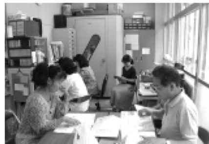
録音風景。奥の防音ボックス内で録音しています。

視覚障害などのハンディキャップを持つ方たちへの情報提供手段として市民活動ニュースの朗読テープ版が出来上がりました。製作していただいたのは津市ボランティア連絡協議会「ぼらんちゃ」編集班のみなさん