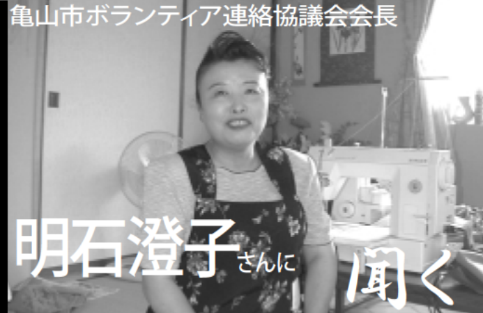
亀山市ボランティア連絡協議会会長

手芸を始めたのは実家の知り合いから廃棄処分しているたくさんの布を貰えることになったから。寮母さんに「何かしない?」って言ったのですがなかなか活動できなくて、私がするようになったんです。布は主人が2トン車に積んで運んでくれるから、「他に欲しいところはないですか?」って三重県社会福祉協議会に聞いたらいろいろ紹介してもらって。平成2年に亀山にできた特養老人ホーム安全の里でも手芸クラブなどのお手伝いをしています。