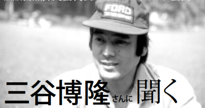
松阪自然探究会代表・松阪シティネット会長