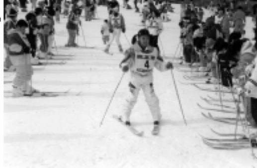
松阪自然探究会「長野林間学校」のスキー教室。