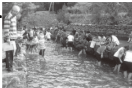
昴学園の生徒たちがアマゴ掴みにチャレンジしているところです。

大杉地区を自然博物館に見立てて、環境教育に利用するフィールドミュージアム事業の拠点です。僕も運営に関係しているんですが、子どもから大人まで自然環境学習や様々な体験ができるようになっているほか、案内人養成なども行っていきますよ。子どもたちは今、どうしても自然から遠ざかっていますから、自然にふれられる