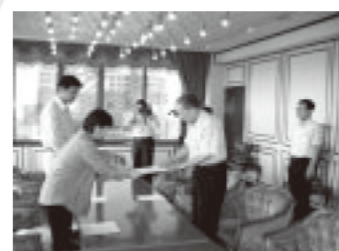
9月20日、四日市市民協働研究会の提言書が四日市市長に手渡されました。

四日市市では、昨年、全国初の議員立法による市民自治基本条例が制定されました。その理念を具体化するため、四日市NPOセクター会議と四日市市議会21会（当選回数1～2回の議員による超党派の会）が連携し、市民活動を促進するためのしくみづくりを目指した「四日市市民協働研究会」が、本年7月に立ち上がりました。7月から9月にかけて6回の研究会を行い、その成果を「四日市市の市民協働を促進させるためのしくみづくりの根拠条例制定に向けた提言書」にまとめ、9月20日市長に提出しました。