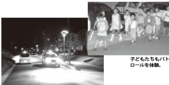
青色回転灯を装着したパトロールカー。夜目にも鮮やかです。

青色回転灯は全国に広まりましたし、視察に来る団体もあります。市民活動団体を行政と警察が支えて活動していくというのは、なかなか難しいようですが、四日市では個性あるまちづくり支援事業の防犯特別枠として、僕らのような防犯団体からPTA、社会福祉協議会、自治会など19の団体が集まって、四日市市地域防犯協議会というのが立ち上がりました。月に1回、会議を行っています。その時は行政、教