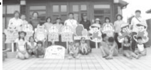
親子で団地内に設置する看板を作りました。

ちと一緒に手作りしているのですが、その材料は行政から頂きました。看板の裏側には、それを作った子どもの名前が書いてあります。自分が作った看板が設置されていたら嬉しいし、こういうイベントだと親子で参加できます。防犯活動には子どもから、高齢者まで。あらゆる世代が関わることが大事だと思うので、いろいろな仕掛けをしています。