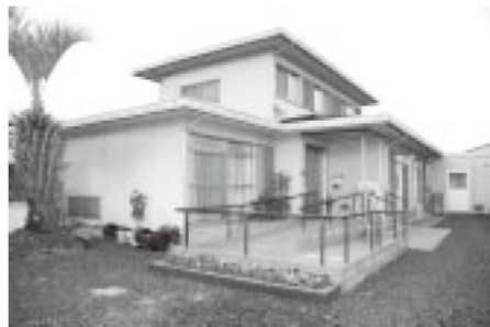
小規模作業所 来夢。平成20年秋に現在地に引っ越しました。