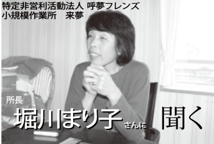
特定非営利活動法人 呼夢フレンズ 小規模作業所 来夢

最初は作業所の駐車場でしたが、今年の秋は大井手地区公園をお借りしました。自治会の了承はすぐ出たのですが、市の公園担当は当初「フリーマーケットは利益を出すから…」