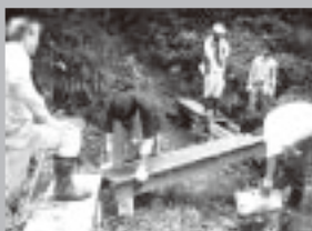
2006年7月15日夏ボラ!「三重の里山を考える会」現場体験

大学生向けに夏休みを利用して社会活動を体験していただく「Volunteer Summer 夏ボラ!体験」を三重大学、三重県社会福祉協議会、NPOと連携して実施しました。