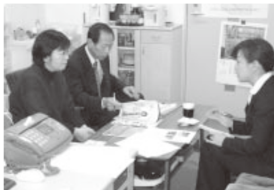
登録者、地域ニーズ、双方の話をじっくり聞き、ベストなマッチングを提案します。

も多く、高齢の方もたくさん住まれていますので、そのような人たちが集まって交流しながら、ちょっとした食事ができるような空間を作りたいと思っています。