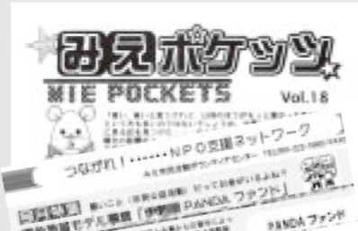
月刊情報紙『市民活動ボランティアニュース』“つながれ!...NPO支援ネットワーク”を担当