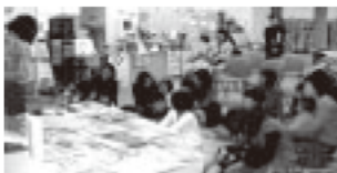
2006年12月23日「おはなしおばさん登場!」

みえ県民交流センターを主に利用しているNPO、ボランティア、市民活動団体の方の協力を得て、活動紹介や活動への想いなどをお話していただき、自発的な社会貢献に関する活動への参加のきっかけづくりを行いました。