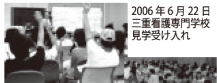
2006年10月20日津市立西が丘小学校出前講座

県内の小中学校、専門学校、また県内外の各種団体からの依頼を受け、ミニボランティア講座や出前講座を実施しました。