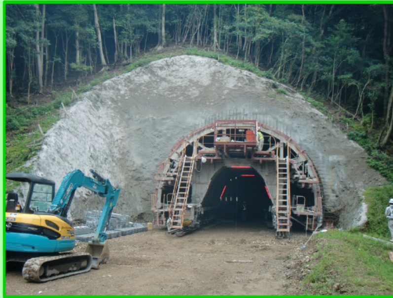
＜起点側坑口の状況＞